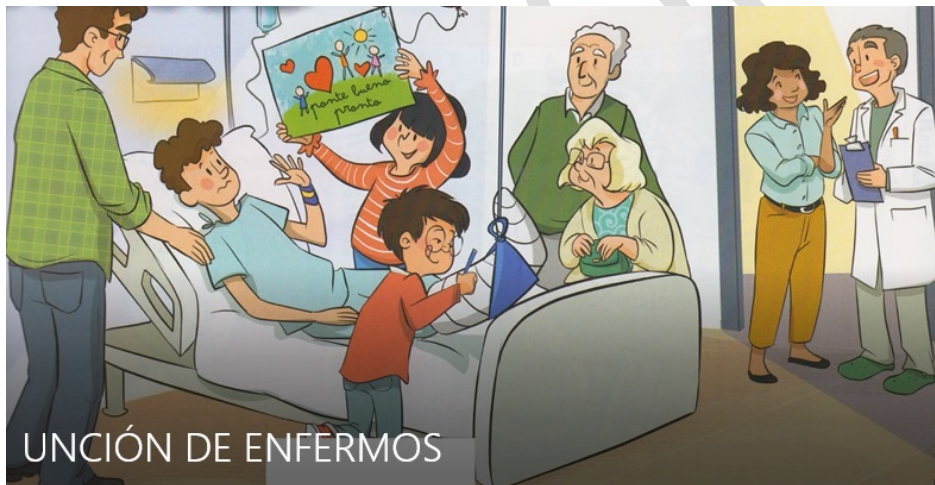
UNCIÓN DE ENFERMOS

Si somos cuerpo y alma...el médico nos cura el cuerpo pero... ¿quién nos cura el alma?