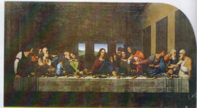
LEONARDO DA VINCI, La última cena

La primera eucaristía se creó en la última cena cuando Jesús reunió a sus discípulos para celebrar la fiesta de la Pascua. Desde aquel momento Jesús se hace presente en el pan y el vino. El pan se convierte en el cuerpo de Jesús y el vino en su sangre. Cuando celebramos la eucaristía recordamos la muerte y resurrección de Jesús. Para los cristianos la celebración de la eucaristía es la fiesta más importante. Es el encuentro de los cristianos con Jesús en la mesa de la comunidad para compartir la vida y la fe.