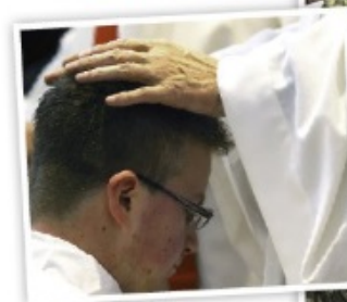
Imposición de manos