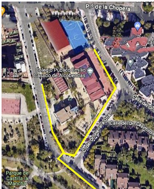
CAMINO AL COLE EMILIO CASADO