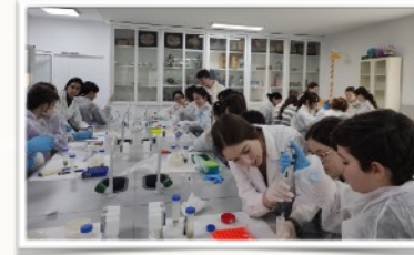
Programas de Idiomas Laboratorio Programa de los años Intermedios Instituto Tecnológicos

Educación Física. Geografía e Historia. Lengua Castellana y Literatura. Lengua Extranjera (Francés o Inglés) Matemáticas. Biología y Geología. Educación Plástica, Visual y Audiovisual. Música. Optativa: 2ª Lengua: Alemán, Francés, Computación. Biología y Geología. Educación Plástica, Visual y Audiovisual. Música. Optativa: 2ª Lengua: Alemán, Francés, Computación.