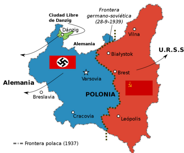
Mapa 1. Mapa de la partición de Polonia entre Alemania y la URSS (1939).