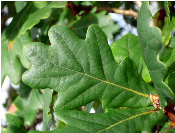
Figura 1. Hoja de quercus robur (roble carballo). Fuente: www.arbolesmadrid.wordpress.com .