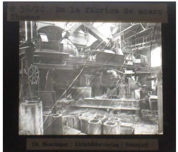
En la fábrica de acero Thomas.