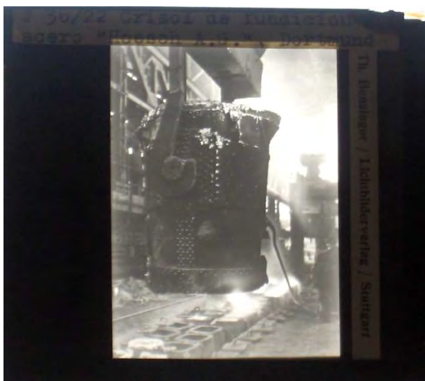
Crisol de fundición de acero. Hoesch AG, Dortmund.