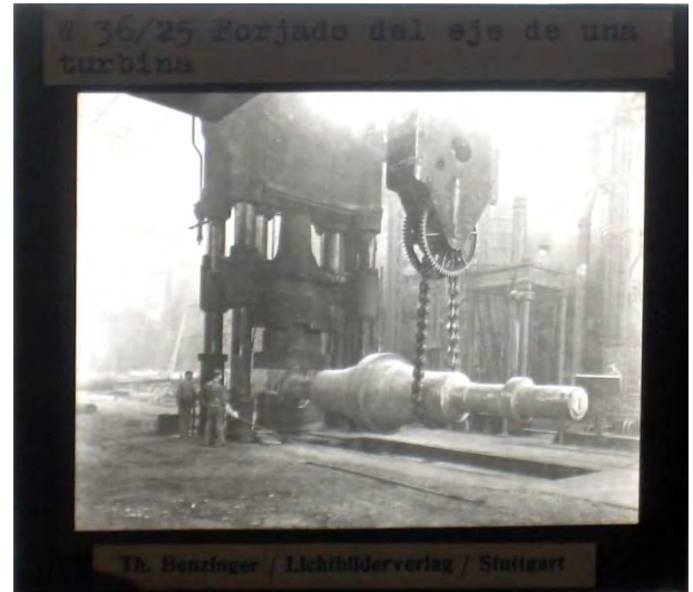
Forjado del eje de una turbina.