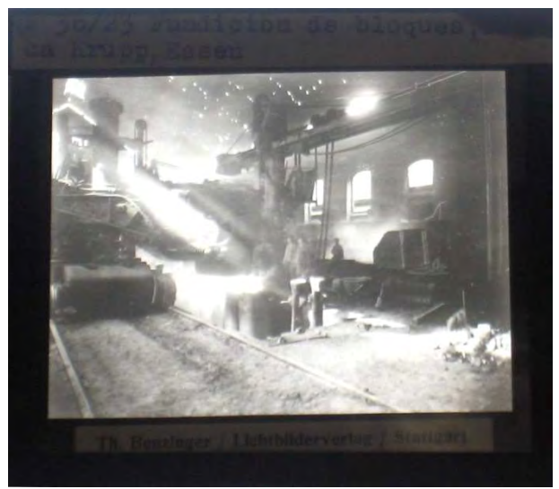
Fundición de bloques. Fábrica Krupp, Essen.