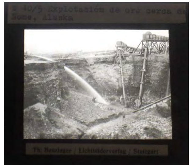
Explotación de oro cerca de Nome. Alaska