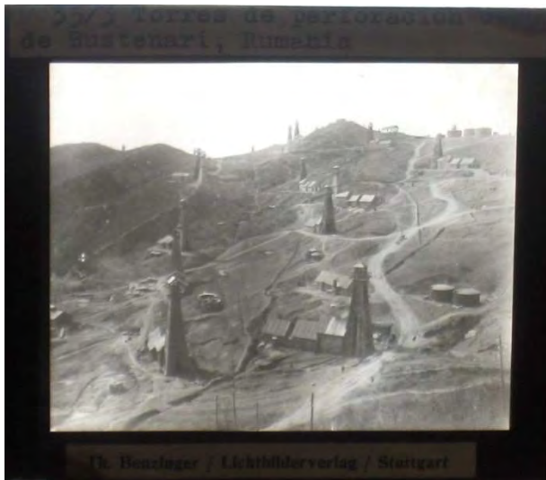
Torres de perforación cerca de Bustenari, Rumanía.