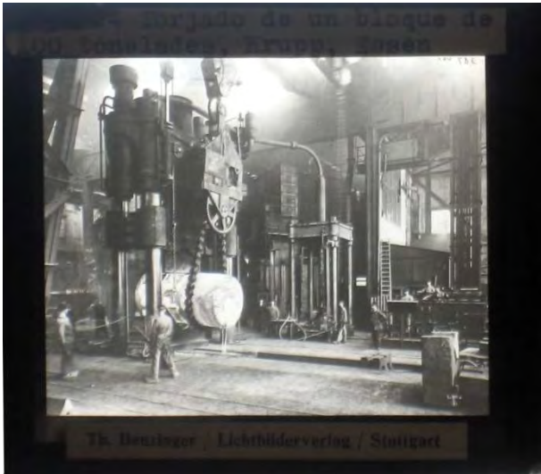
Forjado de un bloque de 100 toneladas. Krupp, Essen