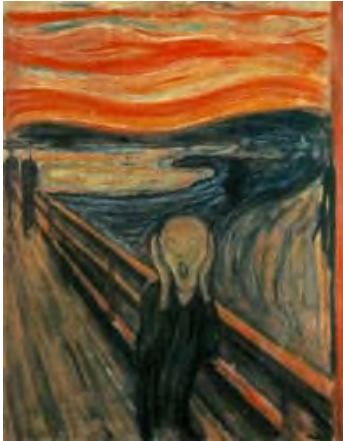
Munch: El grito

Puedes consultar los adjetivos que aparecen al final.