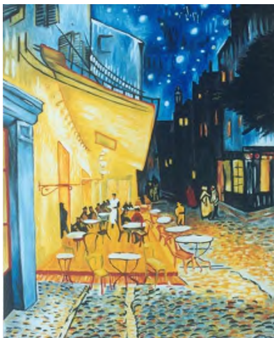
Van Gogh: El café