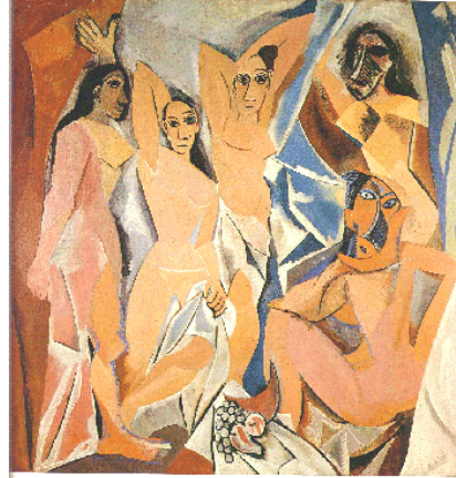
Picasso: Las señoritas de Avignon