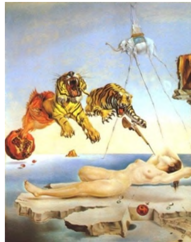
Dalí: Sueño causado por...