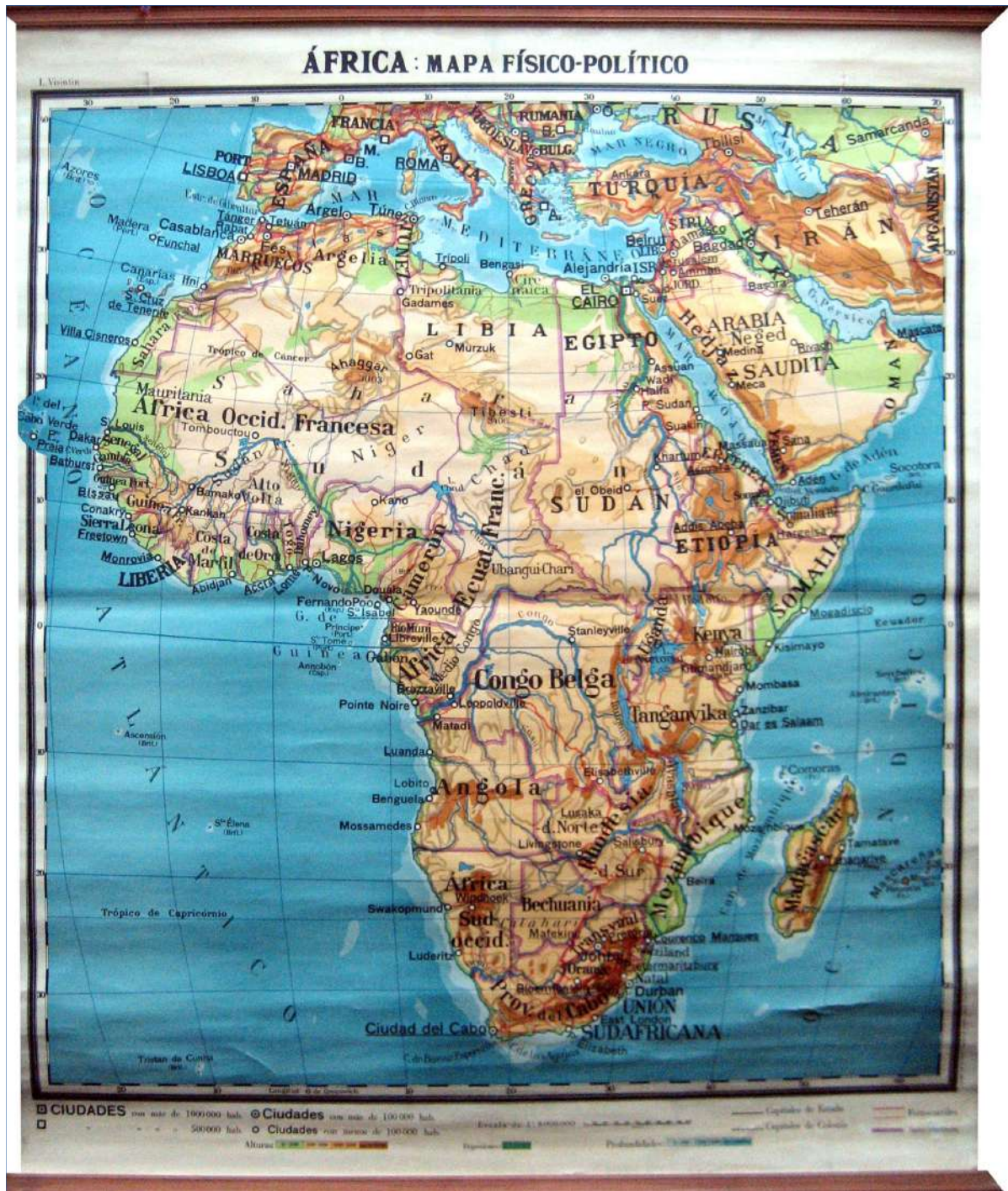
3.- ÁFRICA, MAPA FÍSICO-POLÍTICO 120 x 140 cm.