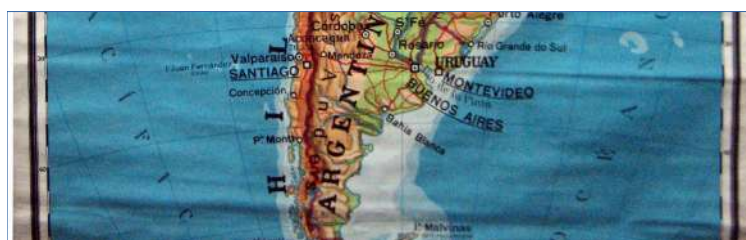
Arrugas y dobleces en el centro.

Copyright 1956 by Istituto Geografico De Agostini - Novara - Printed in Italy