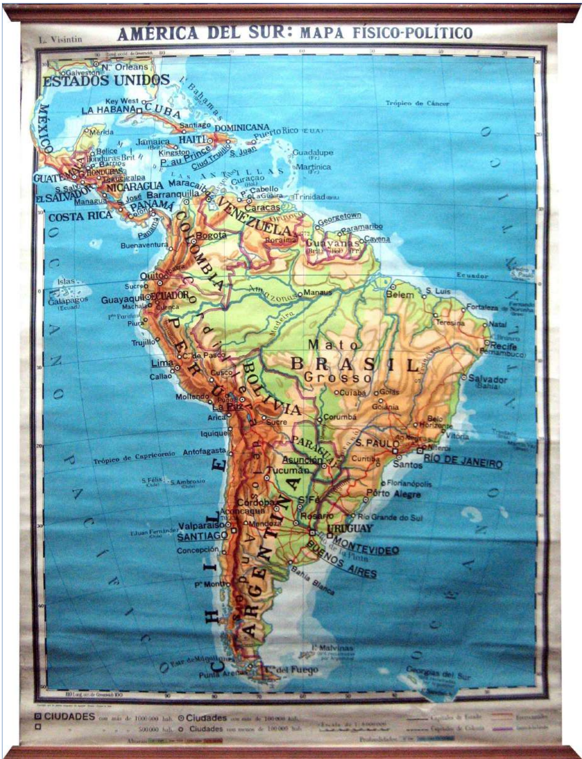
4.- AMÉRICA DEL SUR, MAPA FÍSICO-POLÍTICO 100 x 140 cm.