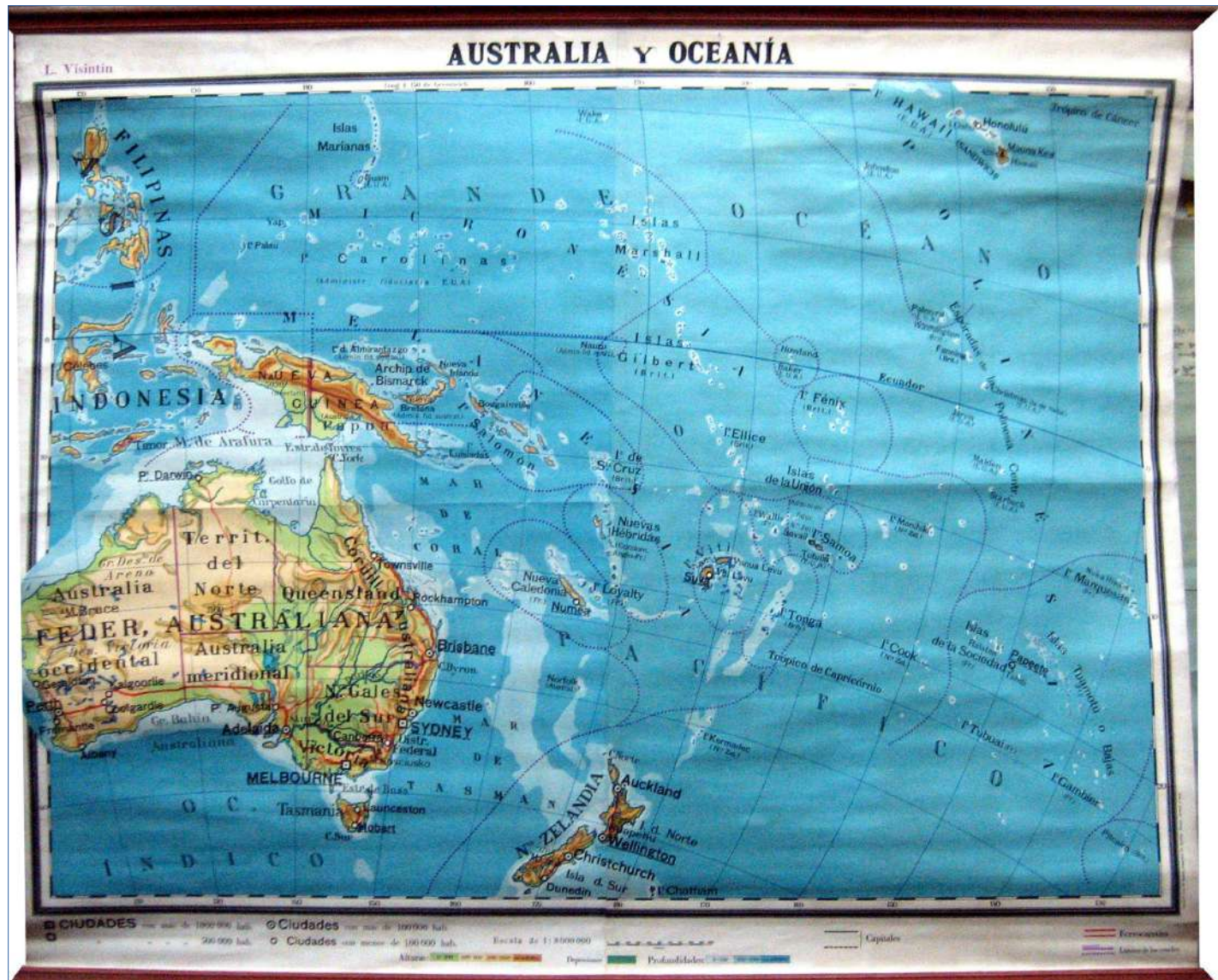
5.- AUSTRALIA Y OCEANÍA 145 x 120 cm.