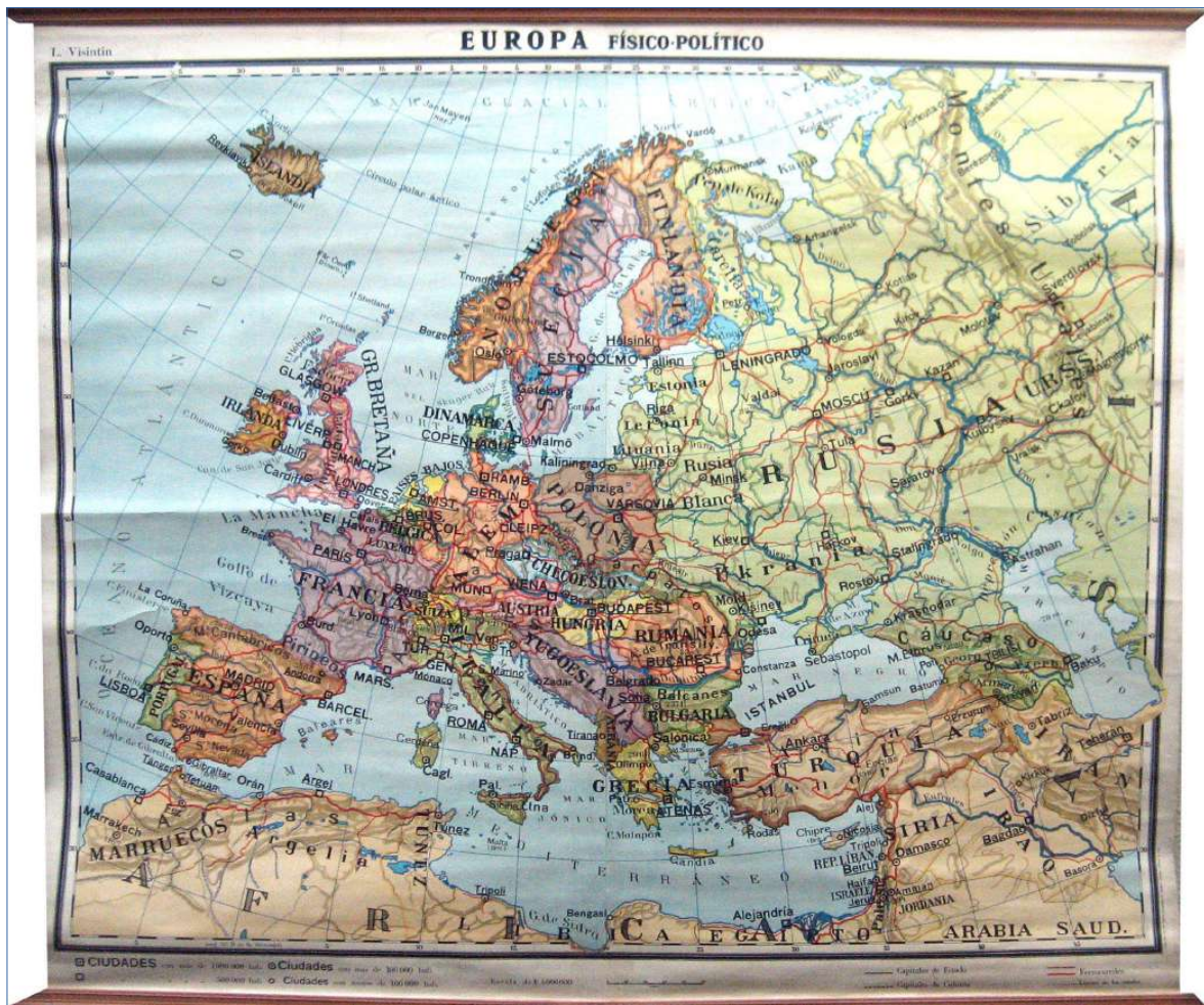
1.- EUROPA, FÍSICO-POLÍTICO 150 x 140 cm.