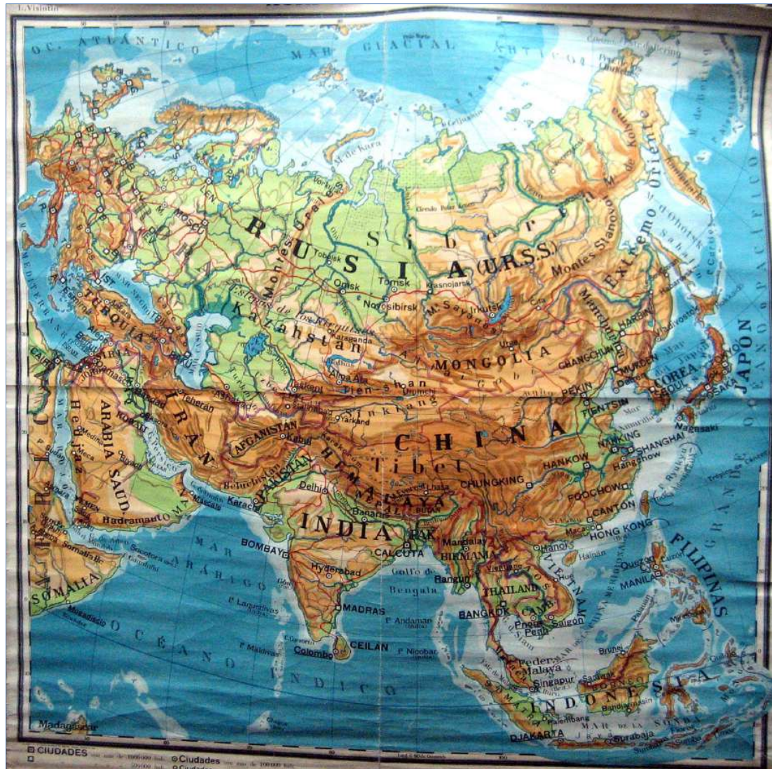
2.- ASIA, MAPA FÍSICO-POLÍTICO 140 x 150 cm.