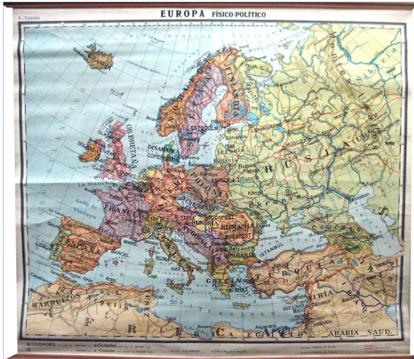
1.- EUROPA, FÍSICO-POLÍTICO 150 x 140 cm.