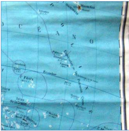
Arrugas y dobleces en el centro.