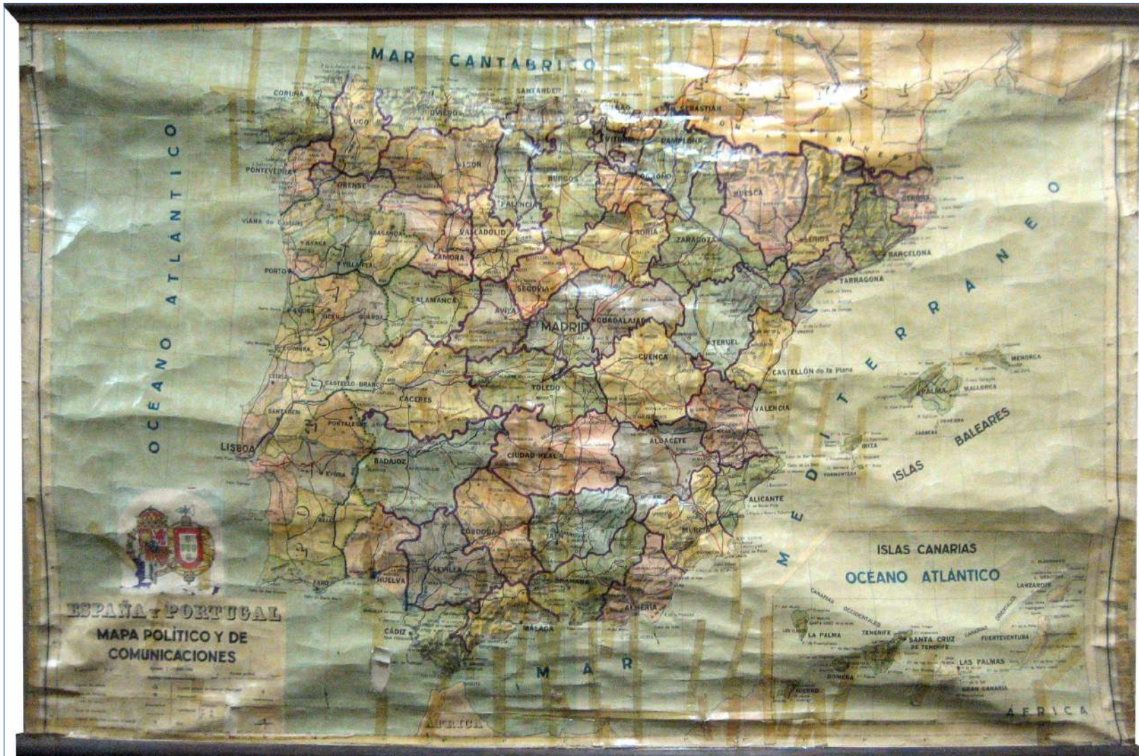
5.- MAPA POLÍTICO Y DE COMUNICACIONES DE ESPAÑA Y PORTUGAL 172 x 107 cm.