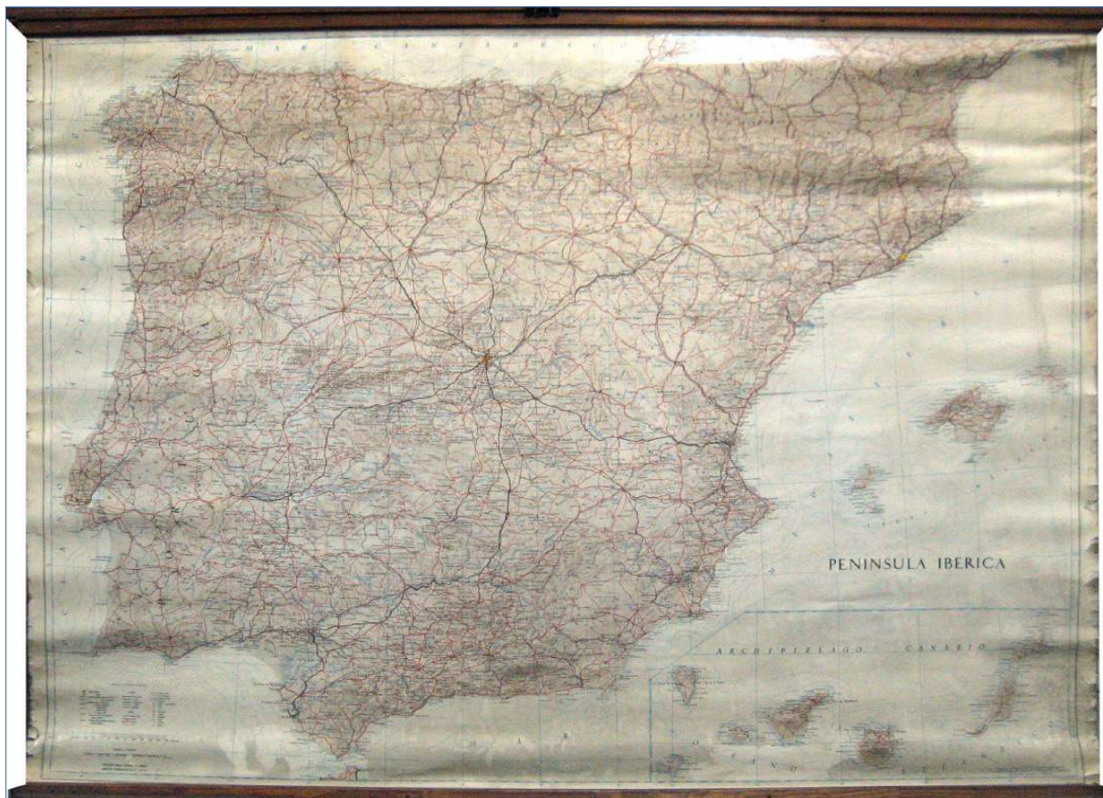
4.- PENÍNSULA IBÉRICA 129 x 98 cm.