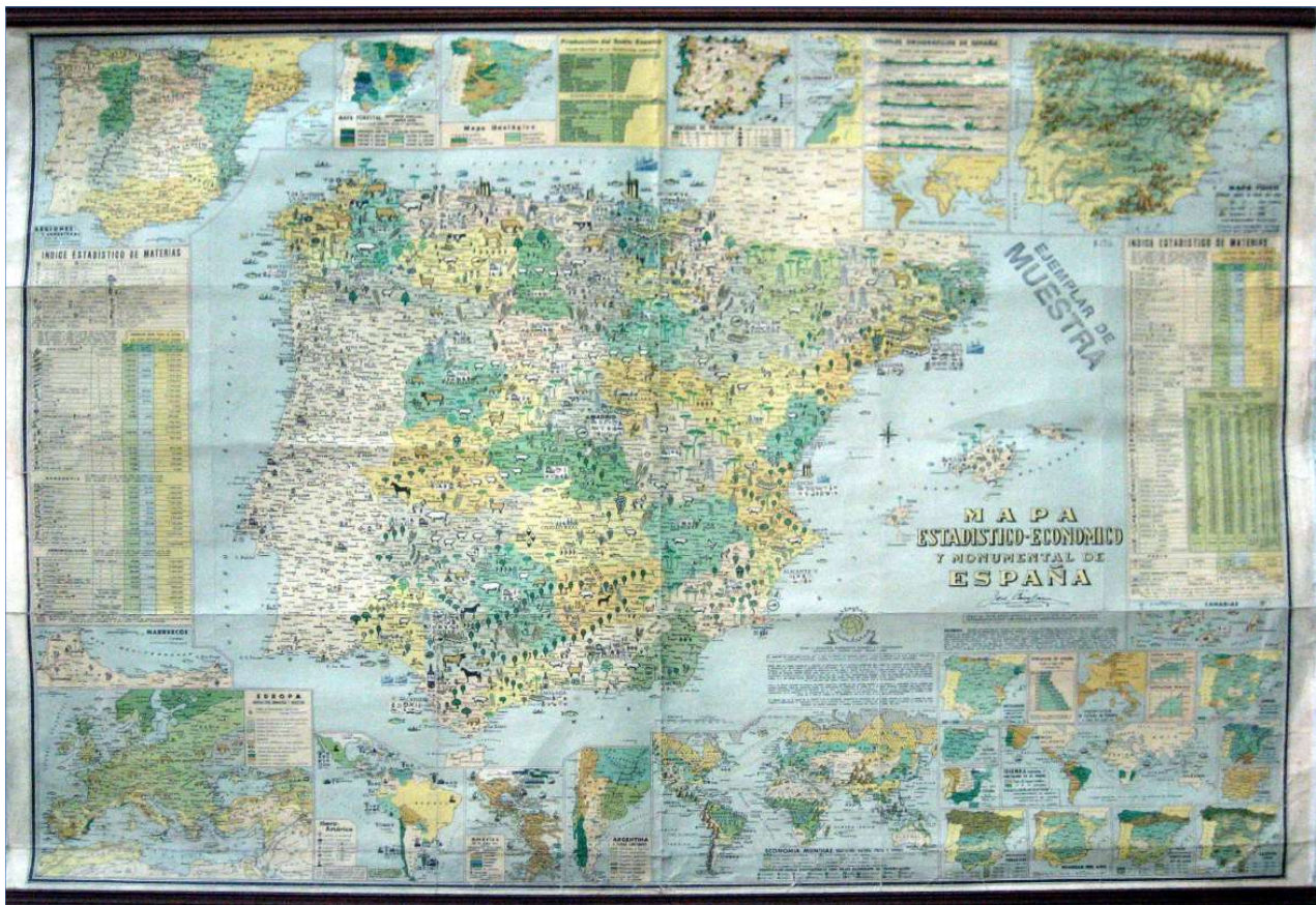
9.- MAPA ESTADÍSTICO-ECONÓMICO Y MONUMENTAL DE ESPAÑA 119 x 88 cm.