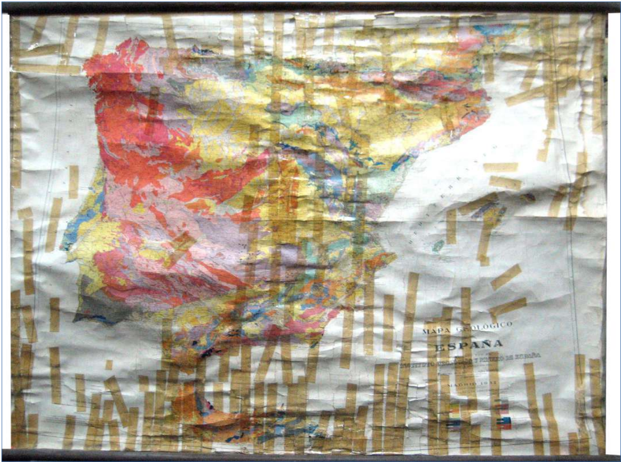
12.- MAPA GEOLÓGICO DE ESPAÑA 150 x 115 cm.