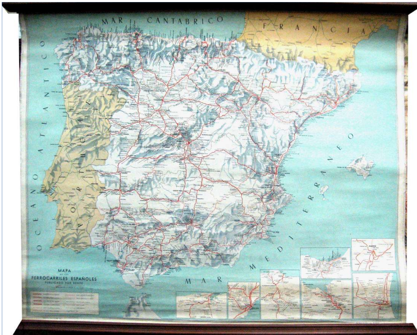
11.- MAPA DE LOS FERROCARRILES ESPAÑOLES 94 x 80 cm.