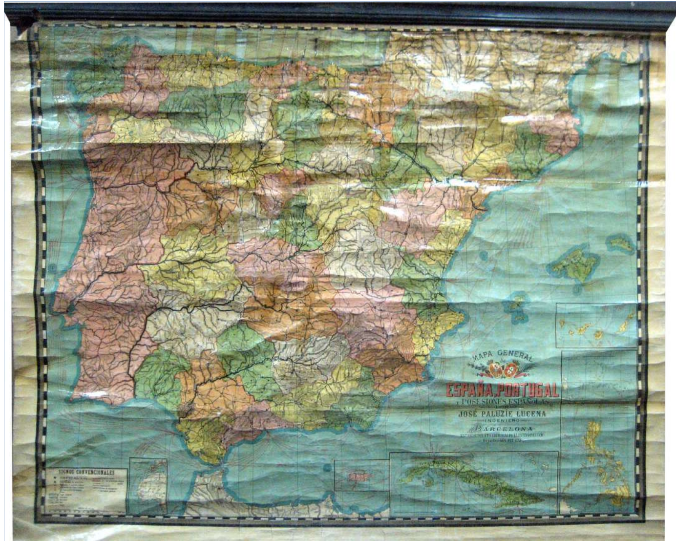
13.- ESPAÑA, PORTUGAL Y POSESIONES ESPAÑOLAS 149 x 128 cm.