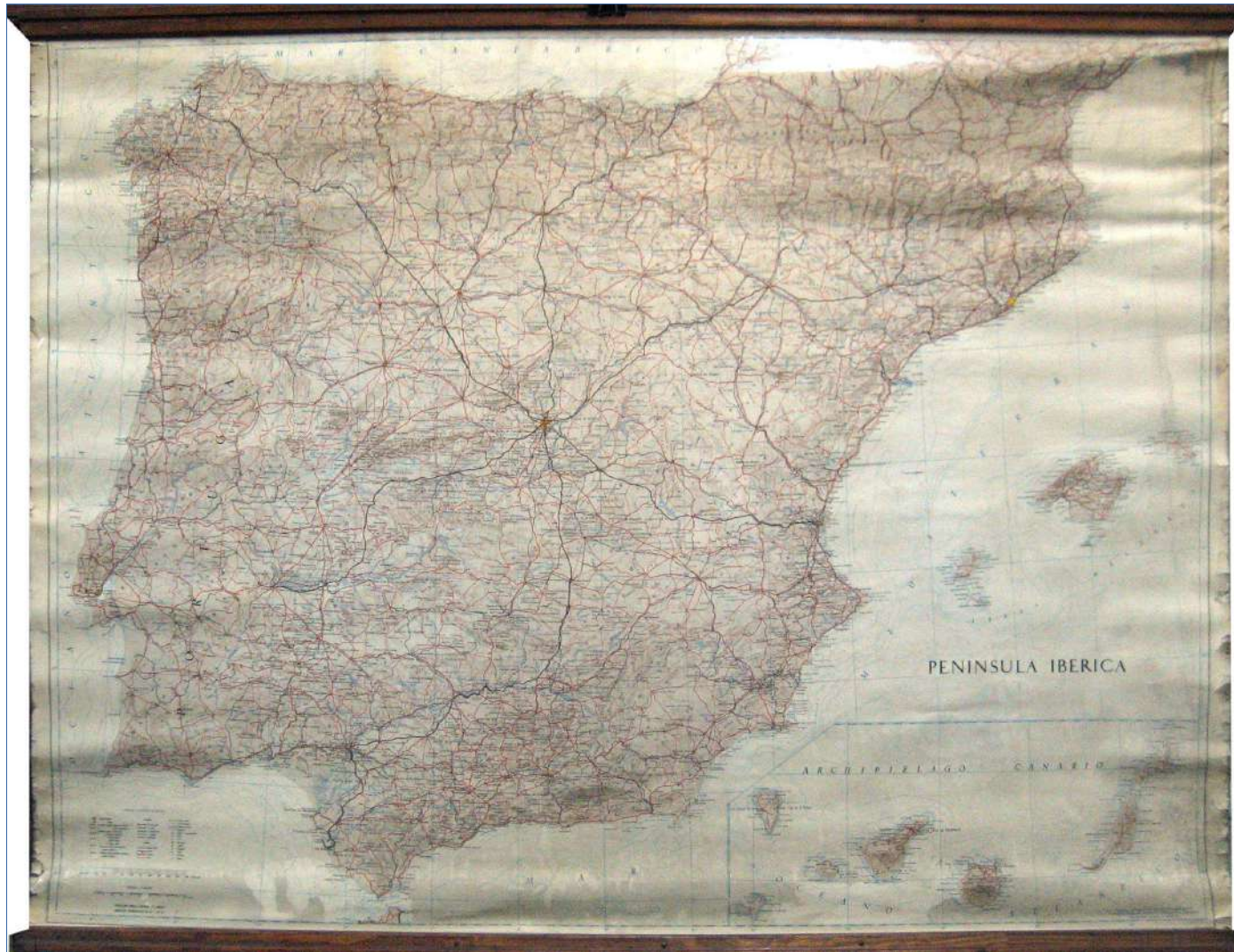
4.- PENÍNSULA IBÉRICA 129 x 98 cm.