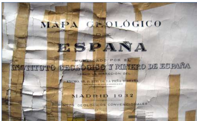
Muchas arrugas, cinta adhesiva y humedades