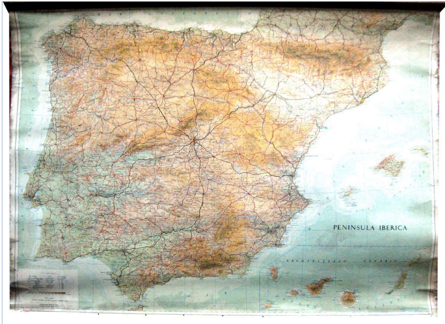
3.- PENÍNSULA IBÉRICA 129 x 96 cm.