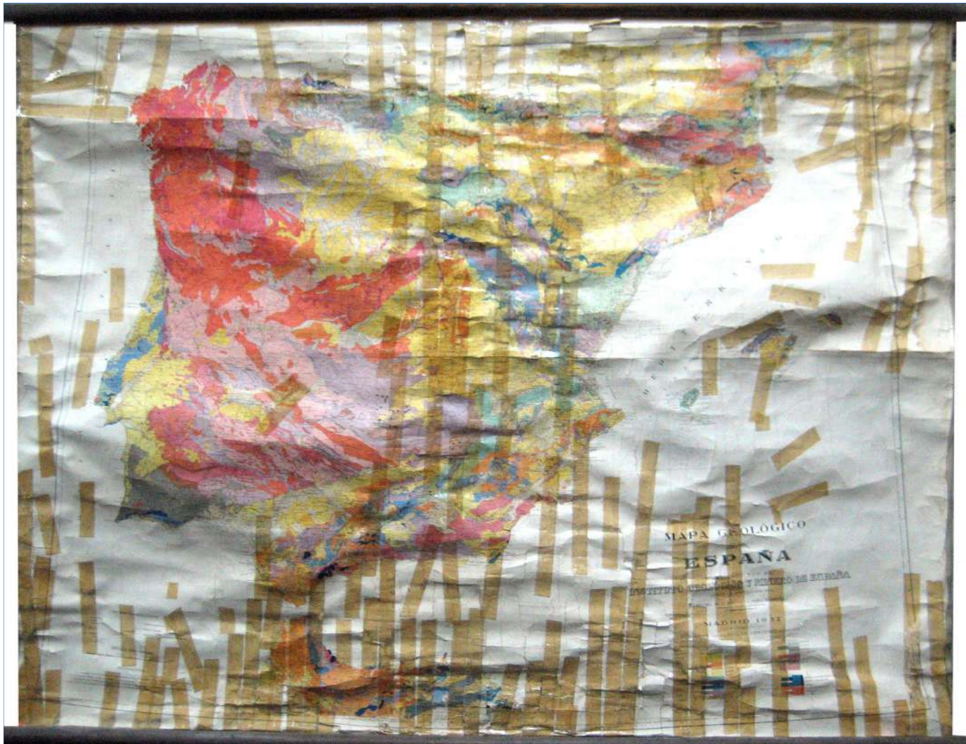
12.- MAPA GEOLÓGICO DE ESPAÑA 150 x 115 cm.