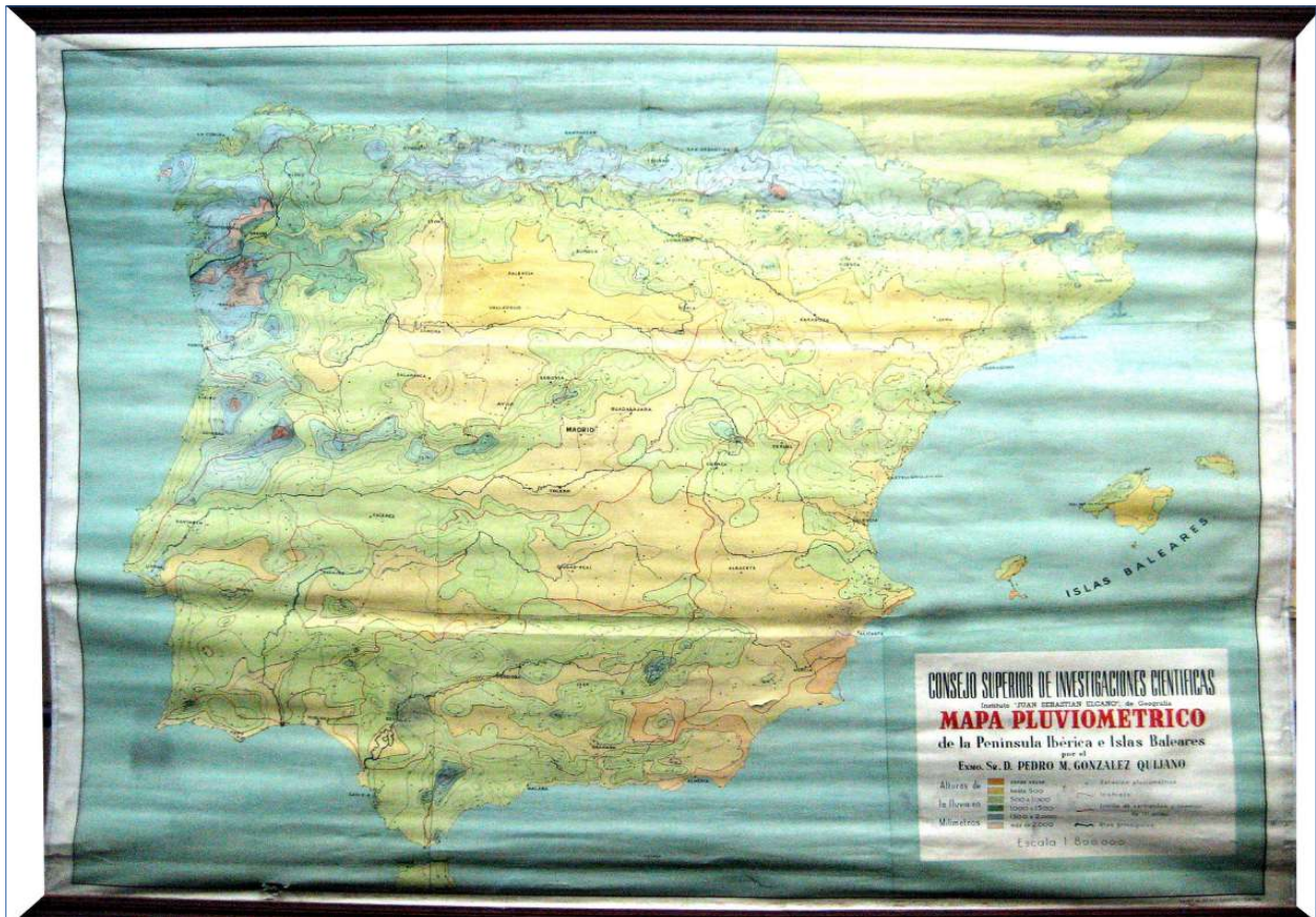
8.- MAPA PLUVIOMÉTRICO DE LA PENÍNSULA IBÉRICA E ISLAS BALEARES 166 x 135 cm.