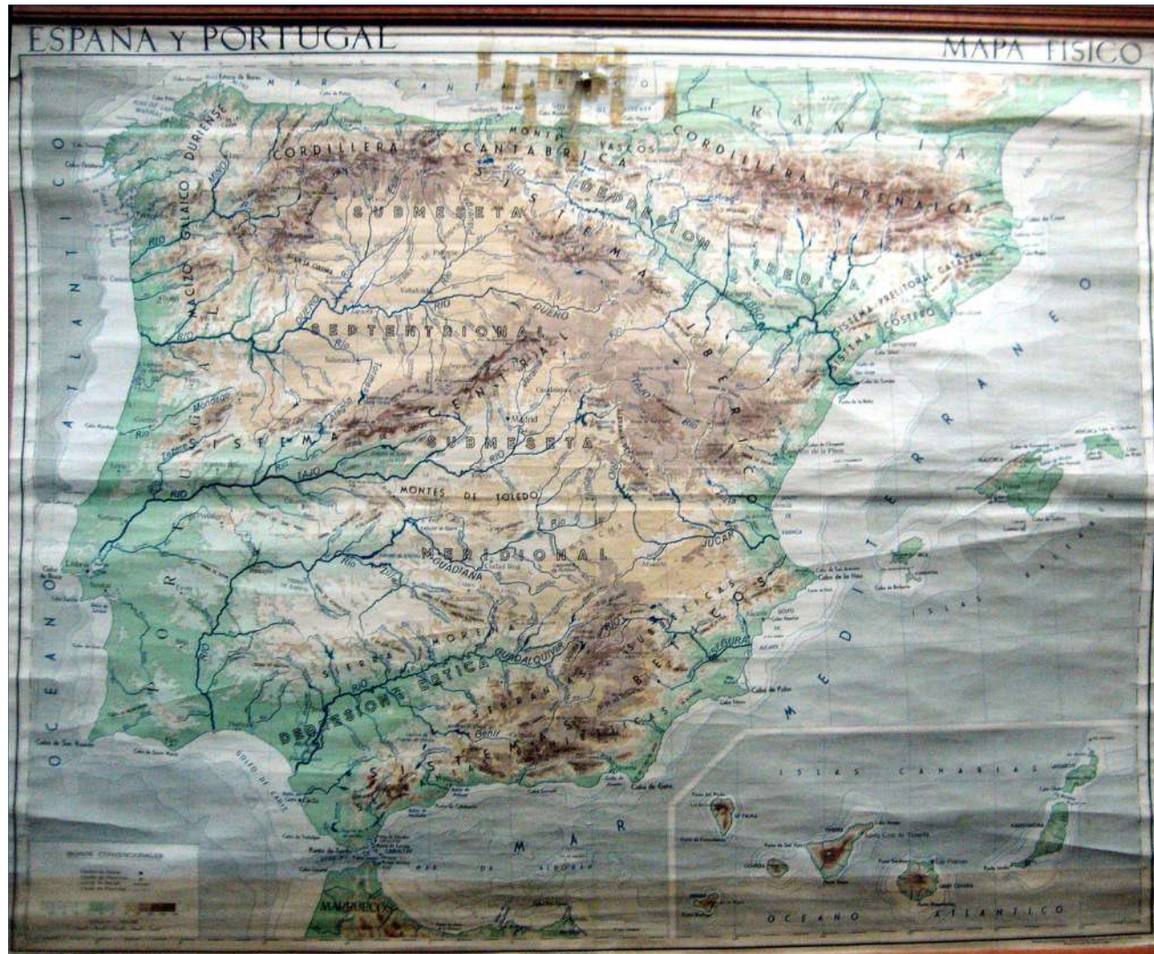
2.- ESPAÑA Y PORTUGAL FÍSICO. 172 x 148 cm.