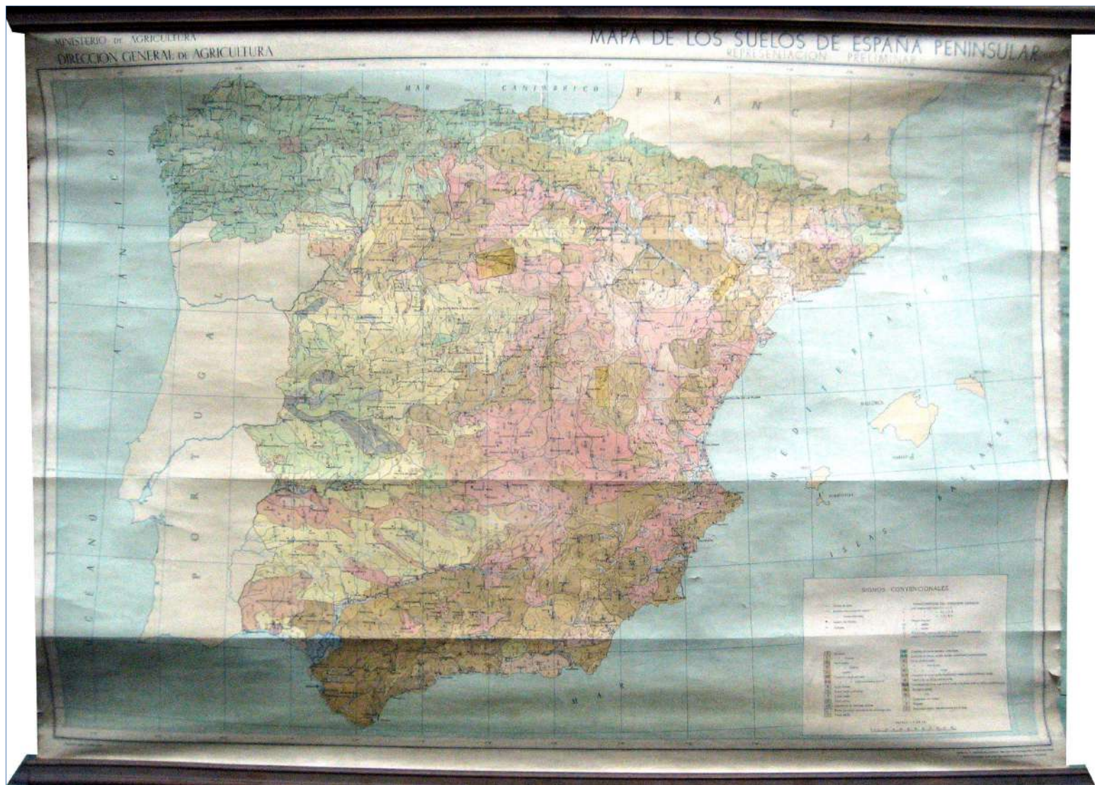
10.- MAPA DE LOS SUELOS DE ESPAÑA PENINSULAR 107 x 78 cm.