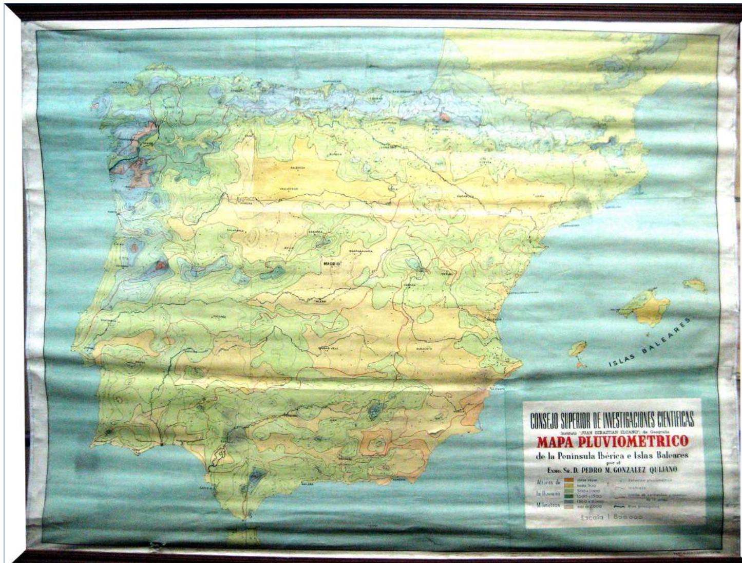
8.- MAPA PLUVIOMÉTRICO DE LA PENÍNSULA IBÉRICA E ISLAS BALEARES 166 x 135 cm.