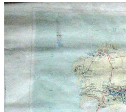
Arrugas en distintos sitios.