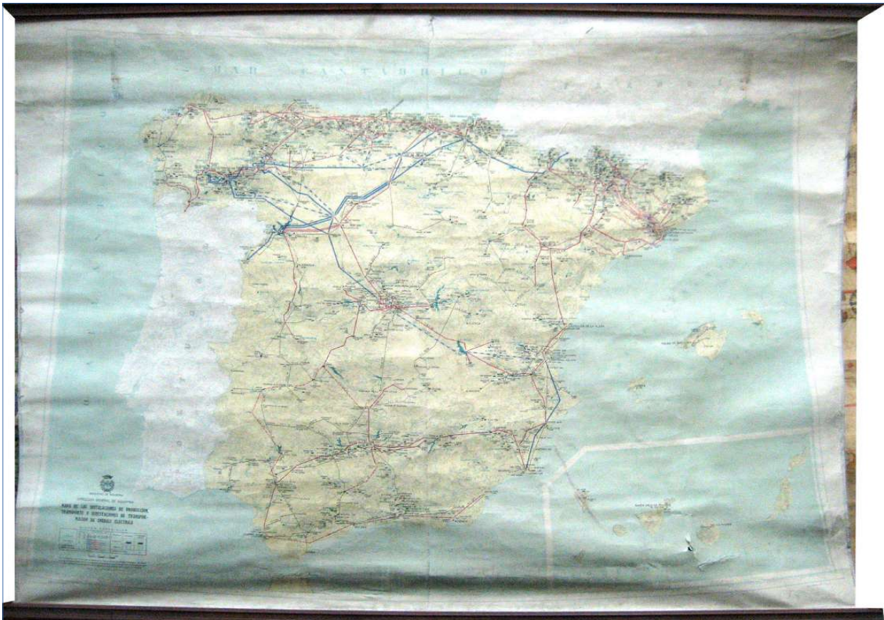
7.- MAPA DE LAS INSTALACIONES DE PRODUCCIÓN, TRANSPORTE Y SUBESTACIONES DE TRANSFORMACIÓN DE ENERGÍA ELÉCTRICA. 130 x 97 cm.