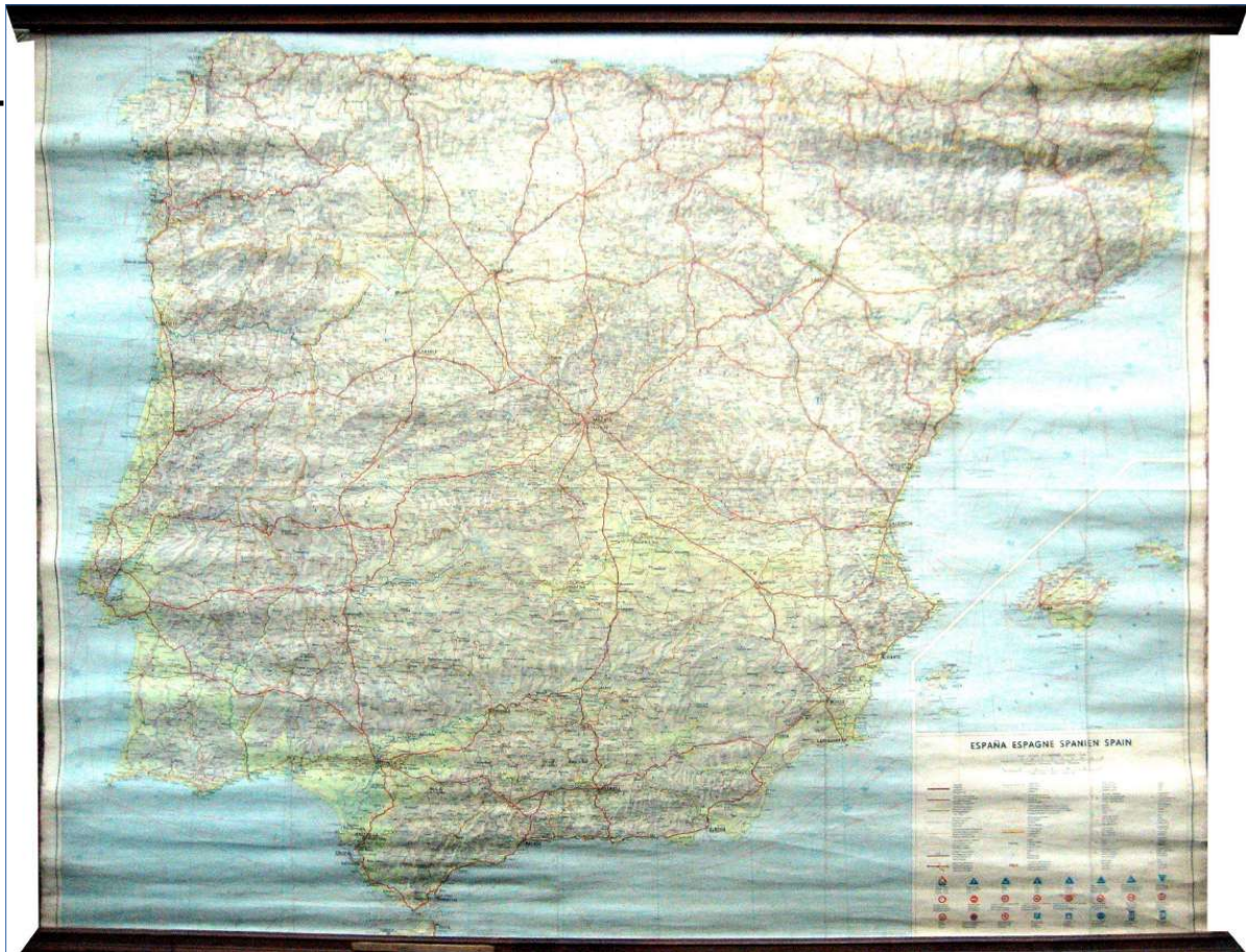
MAPA DE CARRETERAS DE ESPAÑA. 113 x 94 cm.