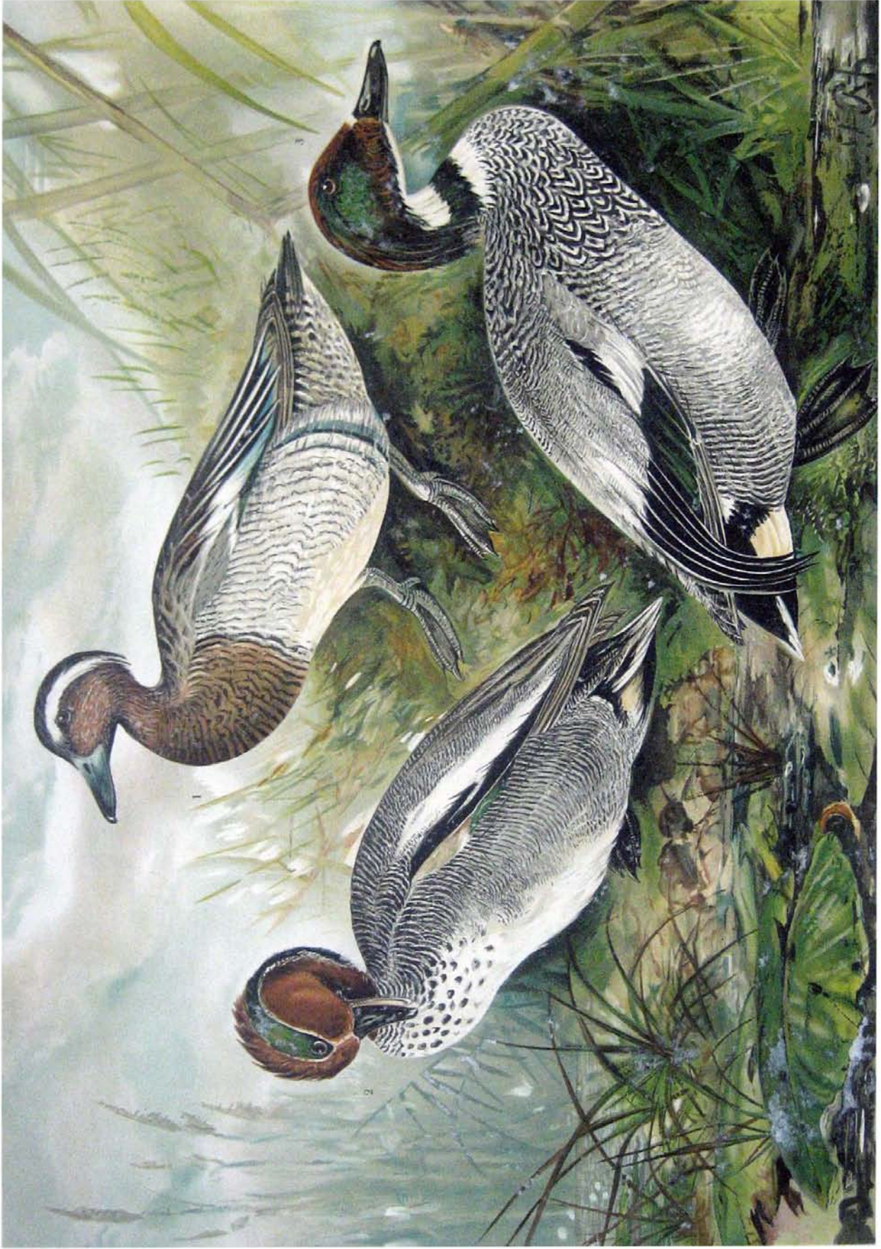
Anas querquedula L. Knäkente. 1 Männchen im Prachtkleide. Anas crecca L. Knäkente. 2 Männchen im Prachtkleide. Anas falcata Georgi. Sichelflügelige Ente. 3 Männchen im Prachtkleide. 2/3 natürl. Grösse.