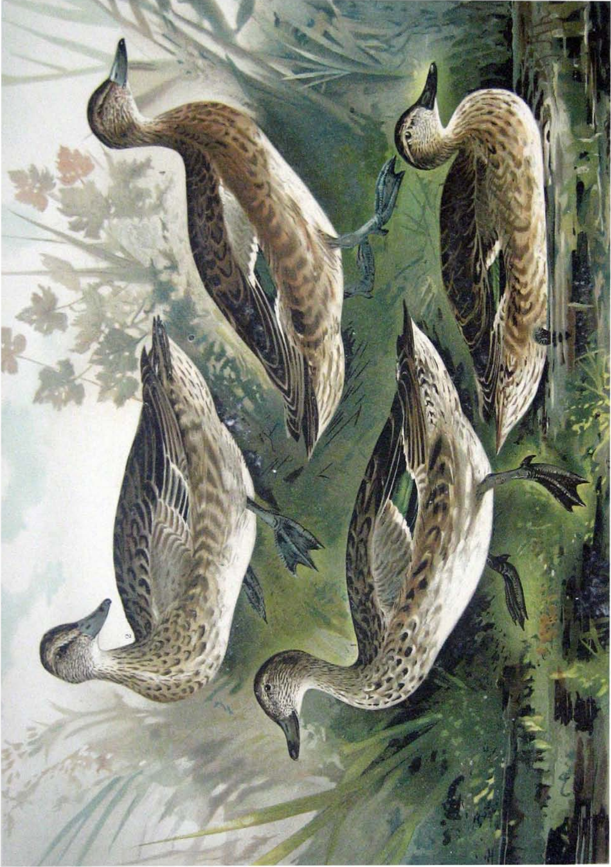
Anas querquedula L. Knäk-Ente. 1 Männchen im Sommerkleide. 2 altes Weibchen. Anas crecca L. Krick-Ente. 3 Männchen im Sommer. 4 altes Weibchen. 1/2 natürl. Grösse.