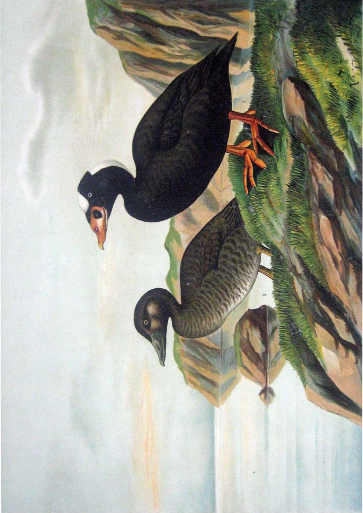
Oidemia perspicillata (L.). Brillen-Ente. 2 / 3 natürl. Grösse. 1 Männchen im Prachtkleide. 2 Weibchen.