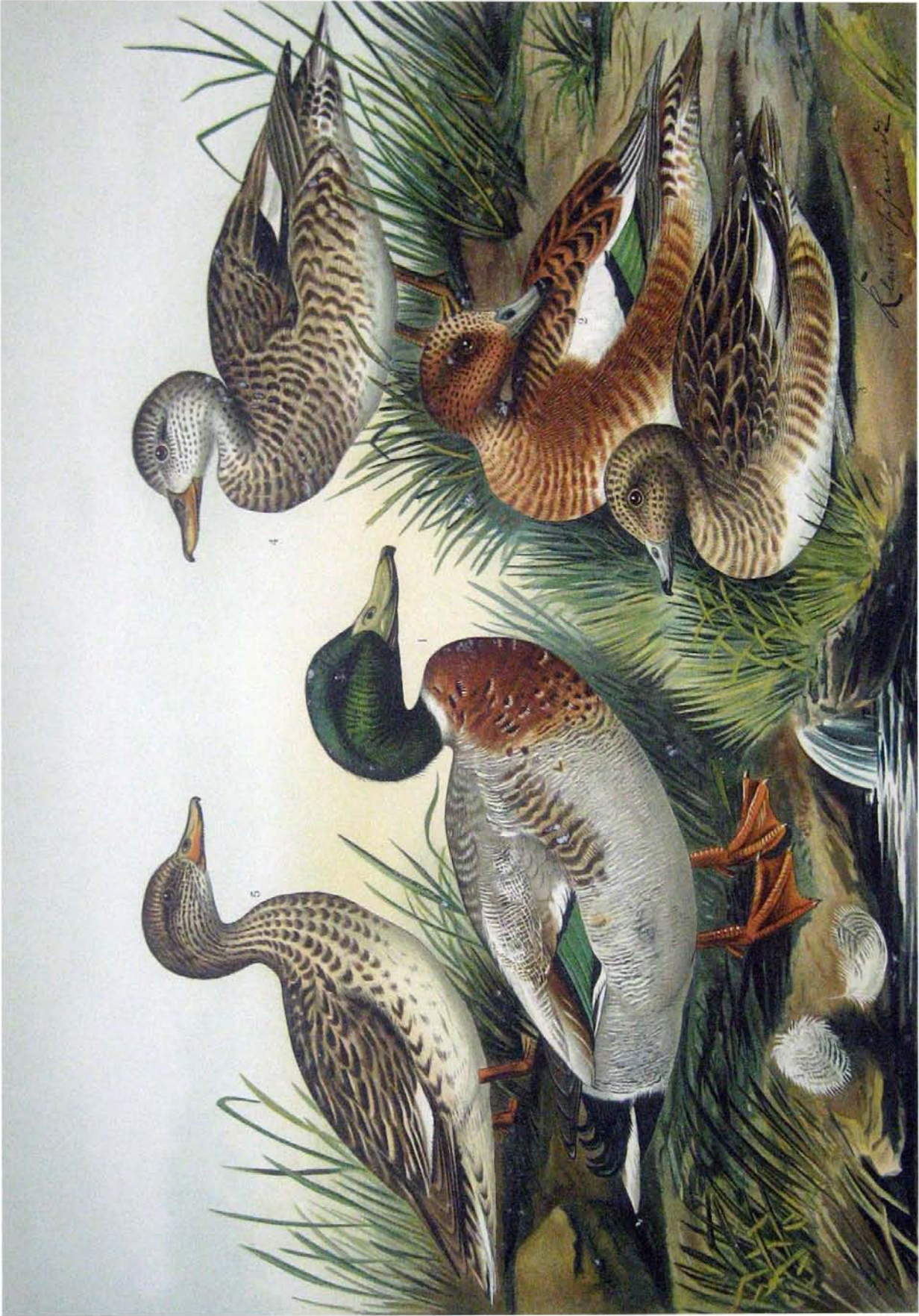
Anas boschas L. März-Ente. 1 Männchen in der Mauser zum Sommerkleide. Anas strepera L. Mittel-Ente. 4 Männchen im Sommerkleide. \frac{3}{4} naturl. Größe. 5 Weibchen Anas penelope L. Pfeif-Ente. 2 Männchen im Sommerkleide. 3 Weibchen.