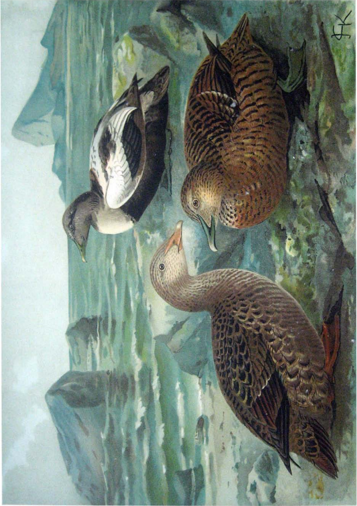
Somateria mollissima (L.). Eiderente. 2 junges Männchen. 3 Weibchen.