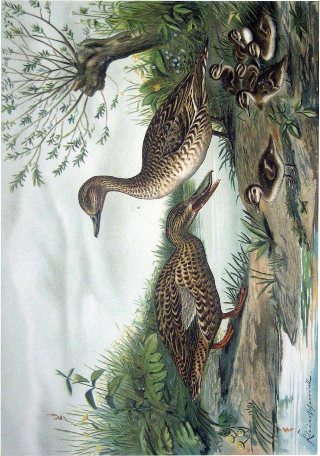
Spatula clypeata (L.). Löffel-Ente. Dafila acuta (L.). Spitz-Ente. 1 Weibchen. 2 Weibchen. 3 Dumerjunge.