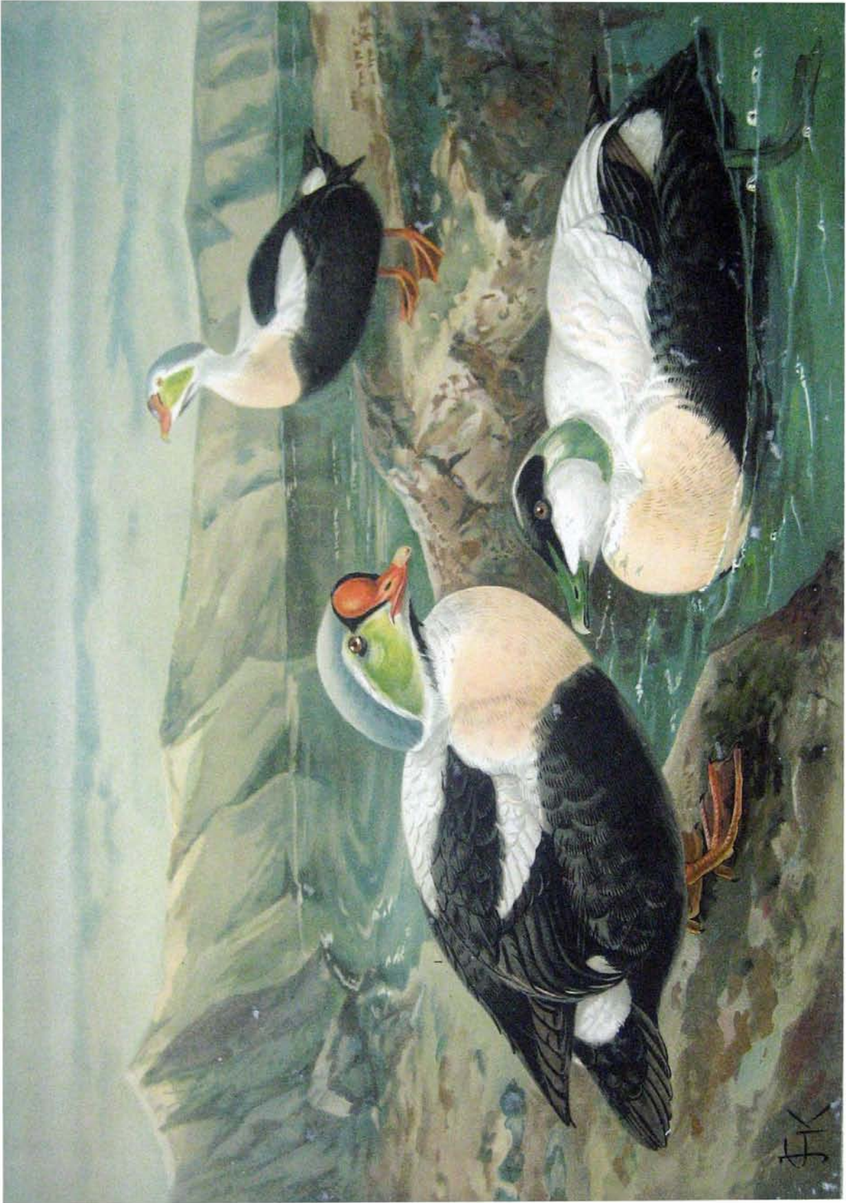
Somateria spectabilis (L.). Pracht-Eiderente. 1 2 Männchen im Prachtkleide. Somateria mollissima (L.). Eiderente. 3 Männchen im Prachtkleide. 1/2 naturf. Größe.