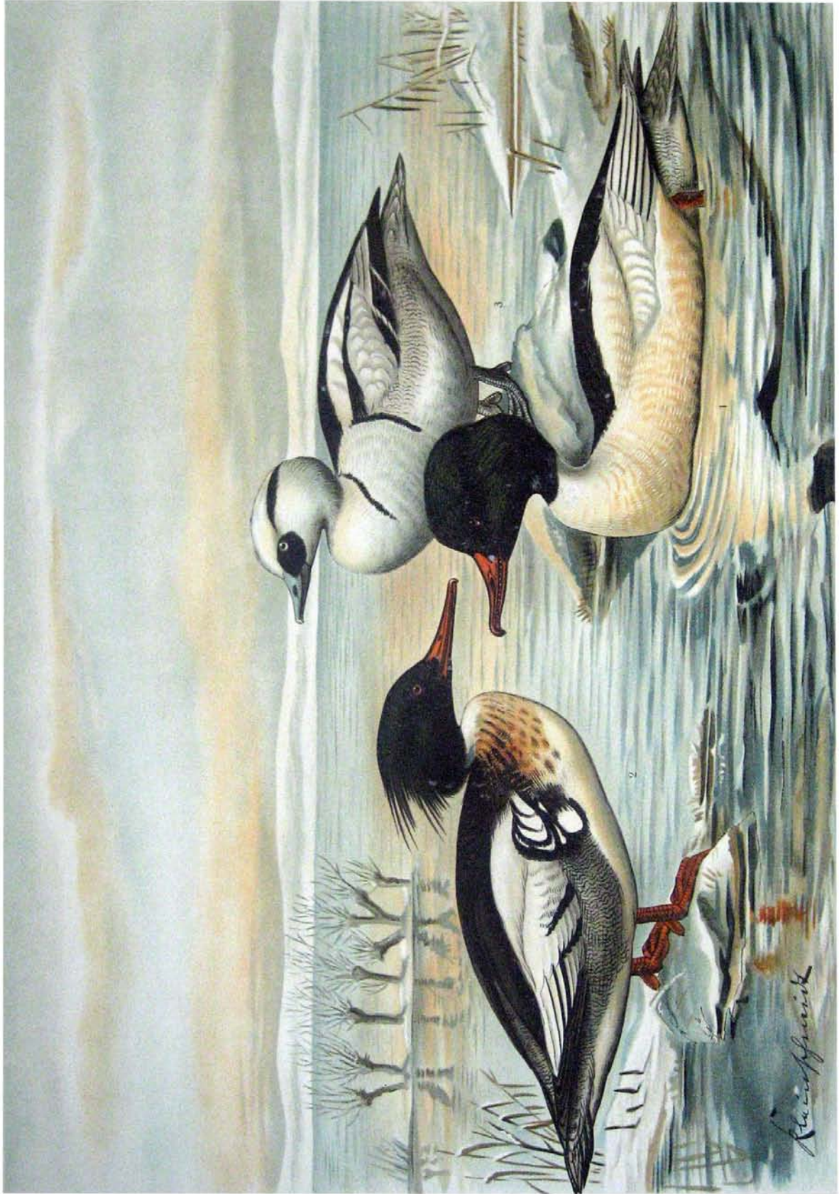
Mergus serrator L. Mittlerer Säger. 2 Männchen im Prachtkleide.