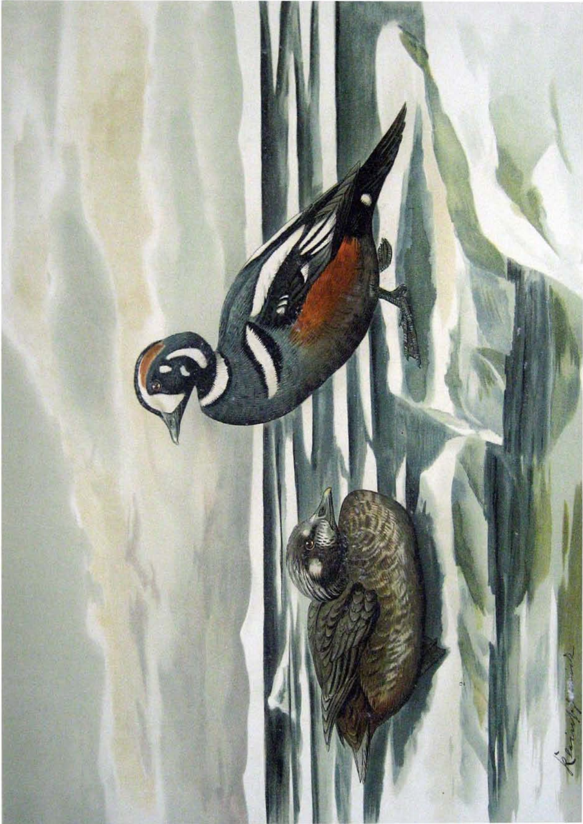
Histrionicus histrionicus (L.). Kragente. 1 alates Männchen im Prachtkleide. 2 junges Weibchen. 3/2 natürl. Grösse.