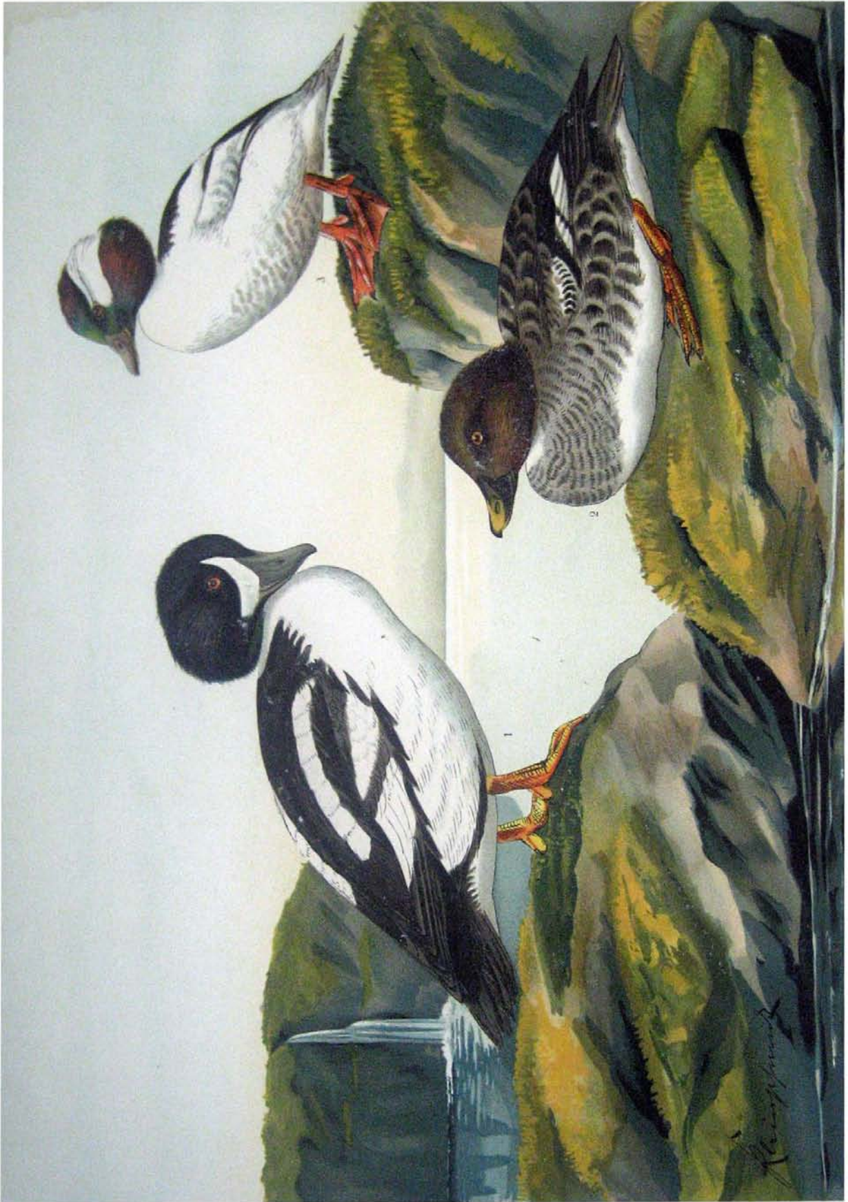
Fuligula islandica (Penn.). Spatel-Ente. Fuligula albeola (L.). Büffel-Ente. 1 Männchen im Prachtkleide. 2 Weibchen. 3 Männchen im Prachtkleide.