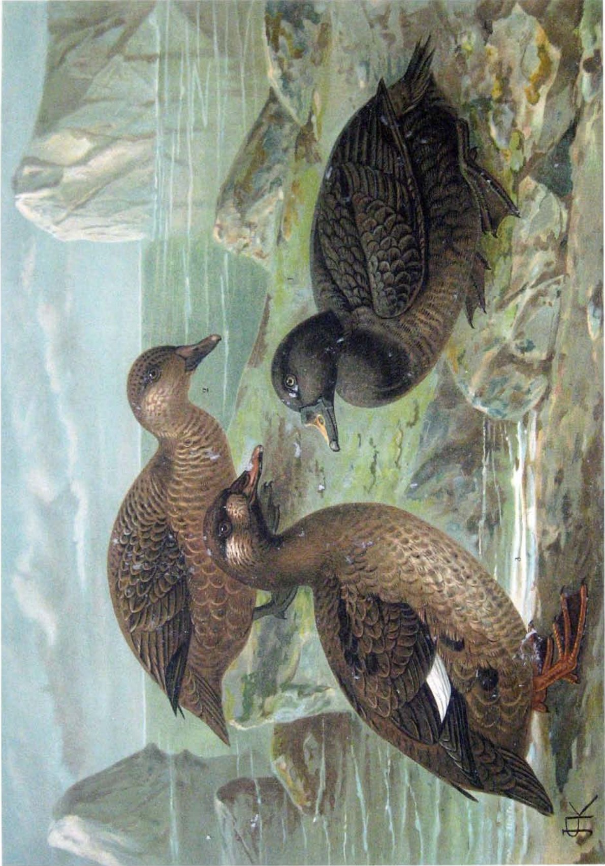
Oidemia nigra (L.). Trauerente. 1 Männchen im Sommer. 2 Weibchen. Oidemia fusca (L.). Samtente. 3/5 natürl. Größe. 3 junges Männchen.