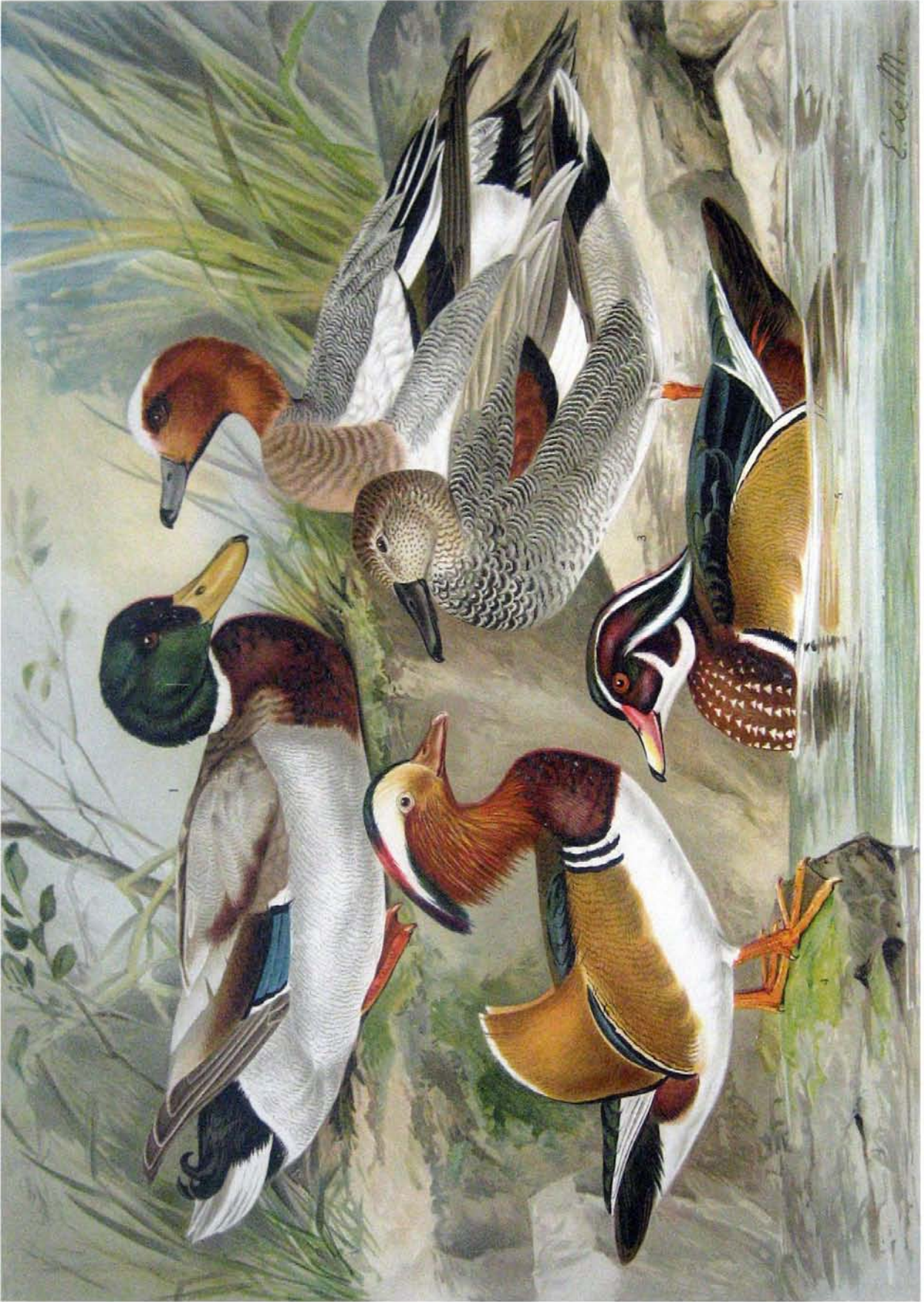
Anas boschas L. März-Ente. 1 Männchen im Prachtkleide. Anas penelope L. Pfeif-Ente. 2 Männchen im Prachtkleide. Anas strepera L. Mittel-Ente. 3 Männchen im Prachtkleide. Aix galericulata (L.) Mandarin-Ente. 4 Männchen im Prachtkleide. Aix sponsa (L.) Braut-Ente. 5 Männchen im Prachtkleide. 2/3 natürl. Grösse.