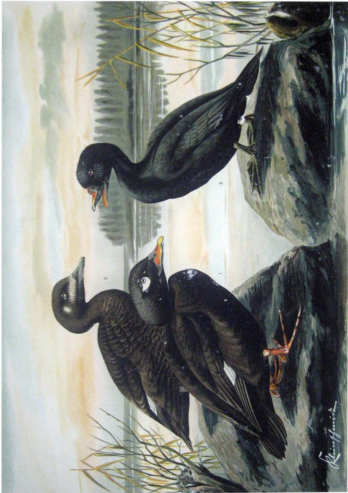
Oidemia fusca (L.). Samtente. 1 Männchen im Prachtkleide. 2 Weibchen. Oidemia nigra (L.). Trauerente. 3 Männchen im Prachtkleide. \frac{1}{2} natürl. Grösse.