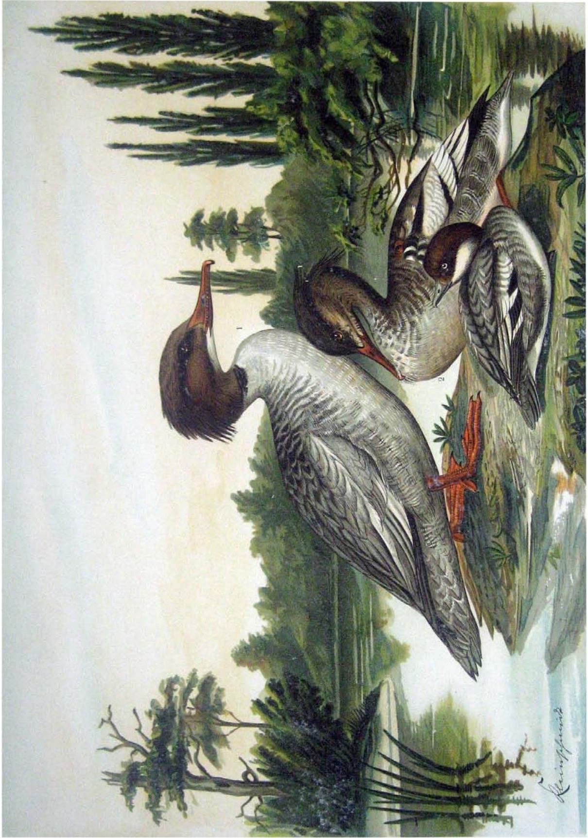
Mergus merganser L. Grosser Säger. 1 junges Männchen. Mergus serrator L. Mittlerer Säger. 2 Männchen im Sommerkleide.