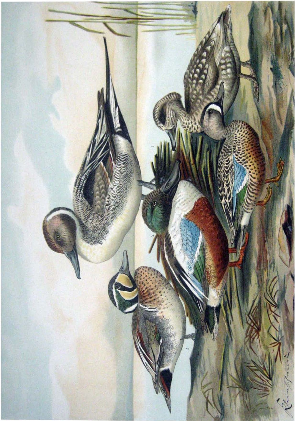
Dafila acuta (L.) Spitz-Ente. 1 Männchen im Prachtkleide. Spatula clypeata (L.) Löffel-Ente. 2 Männchen im Prachtkleide. Anas formosa Georgi. Pracht-Ente. 3 Männchen im Prachtkleide. Anas discors L. Blauflügel-Ente. 4 Männchen im Prachtkleide. Anas angustirostris Menetr. Marmel-Ente. 5 Männchen im Prachtkleide.