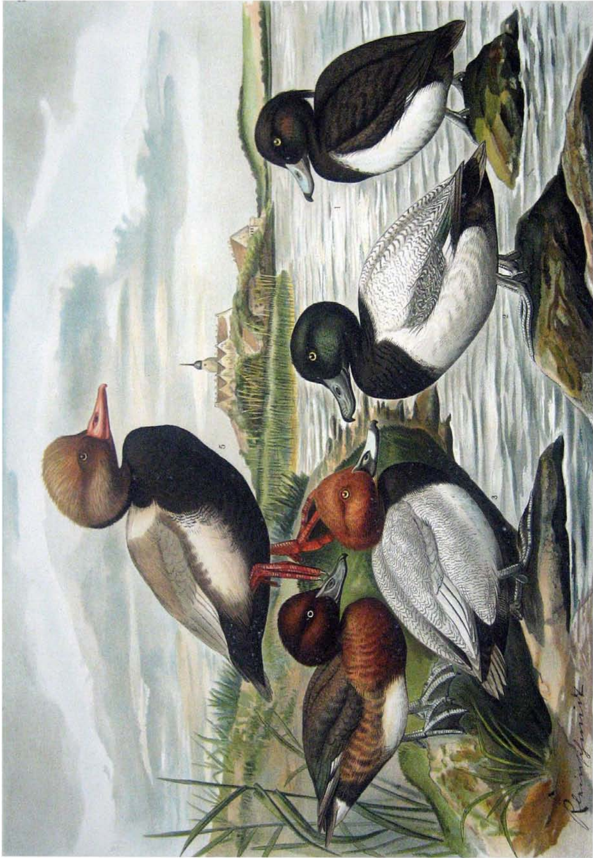
Fuligula fuligula (L.). Reiher-Ente. 1 Männchen im Prachtkleide. Fuligula marila (L.). Berg-Ente. 2 Männchen im Prachtkleide. Fuligula ferina (L.). Tafel-Ente. 3 Männchen im Prachtkleide. Fuligula nyroca (Güldenst.). Moor-Ente. 4 Männchen im Prachtkleide. Fuligula rufina (Pall.). Kolben-Ente. 5 Männchen im Prachtkleide. 1/2 natürl. GröÙe.