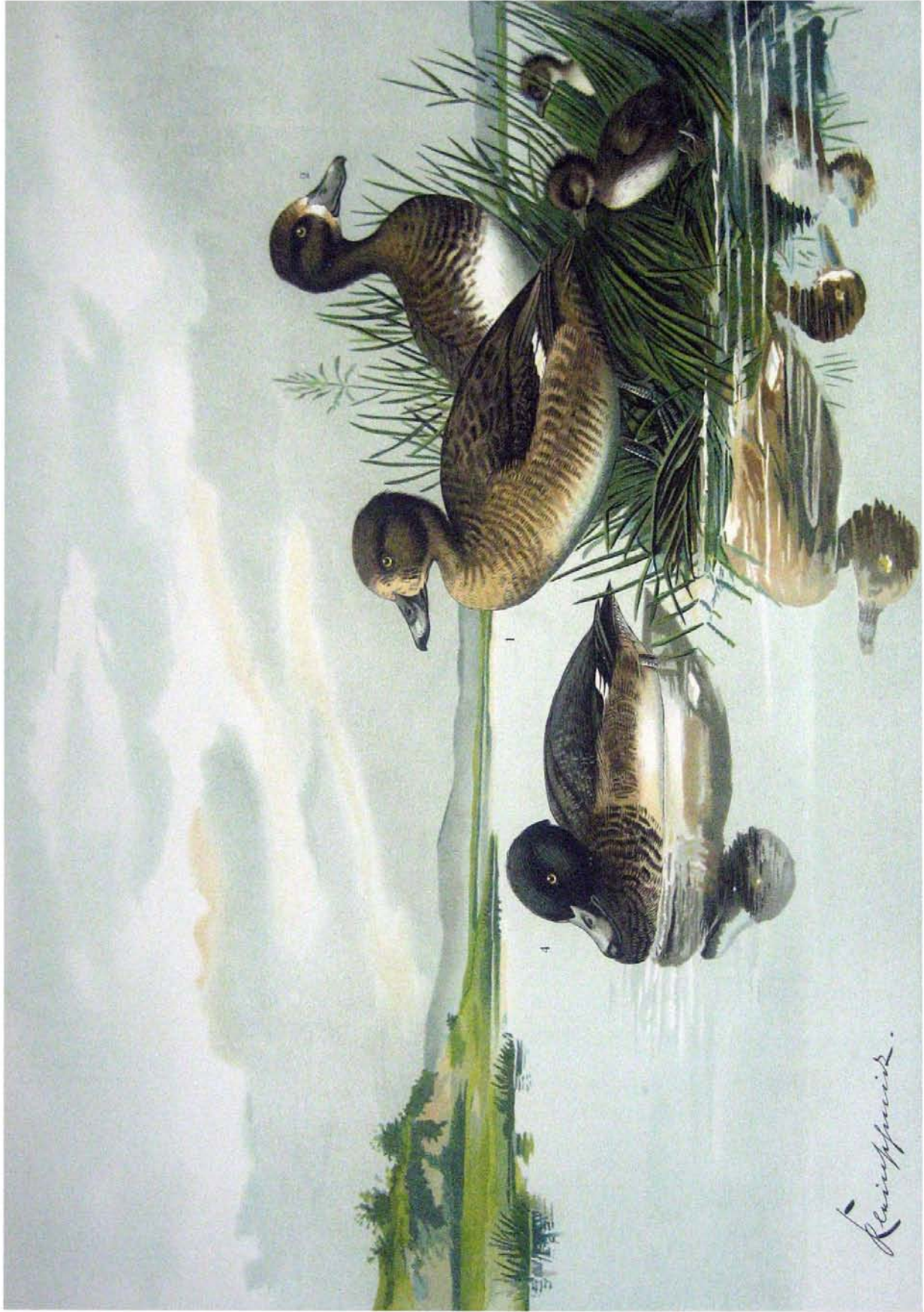
Fuligula fuligula (L.). Reiherente. 1 Weibchen im Jugendkleid. 2 Dunenkleid. 4 Männchen im Sommer. 3/4 natürl. Grösse.