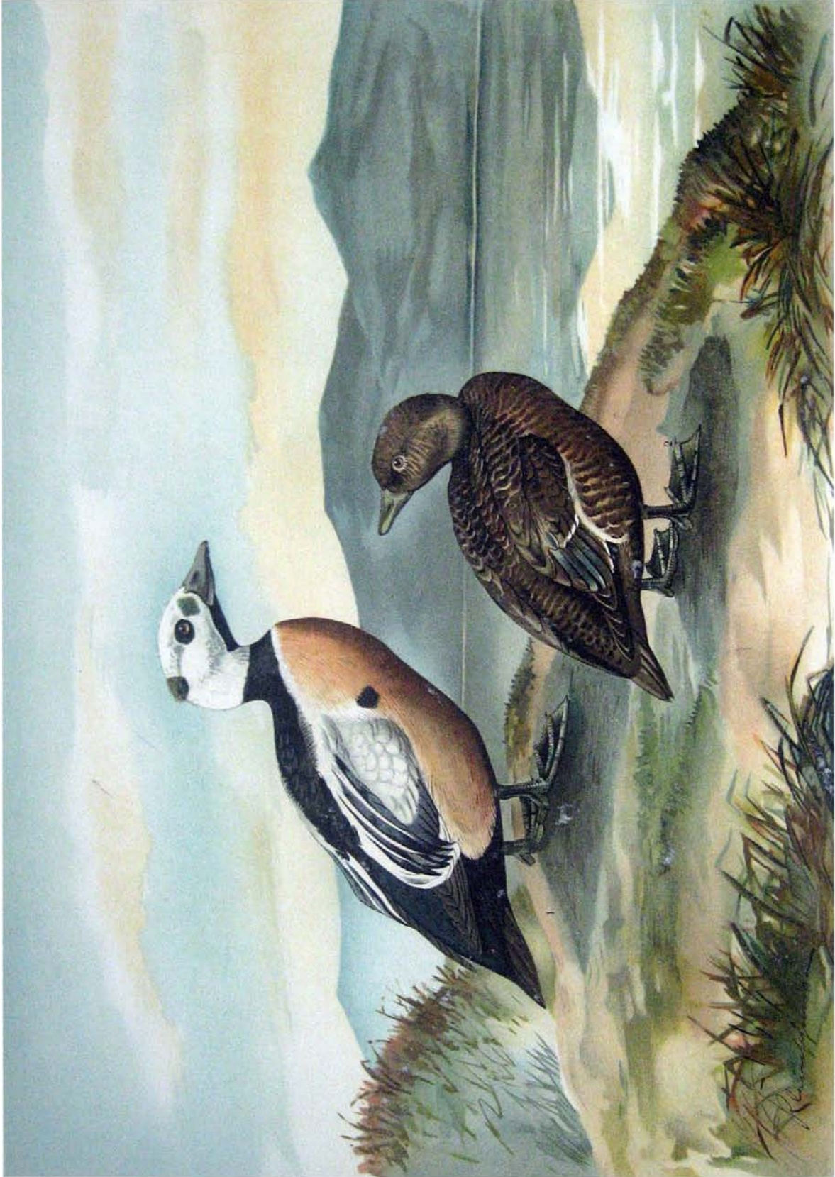
Eniconetta Stelleri (Pall.). Scheckente. 1 altes Männchen Prachtkleide. 2 junges Männchen. Fr. nunnari, Grasse.