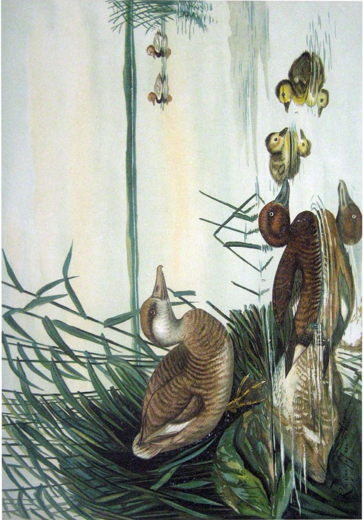
Fuligula rufina (Pall.). Kolben-Ente. 1 Weibchen.