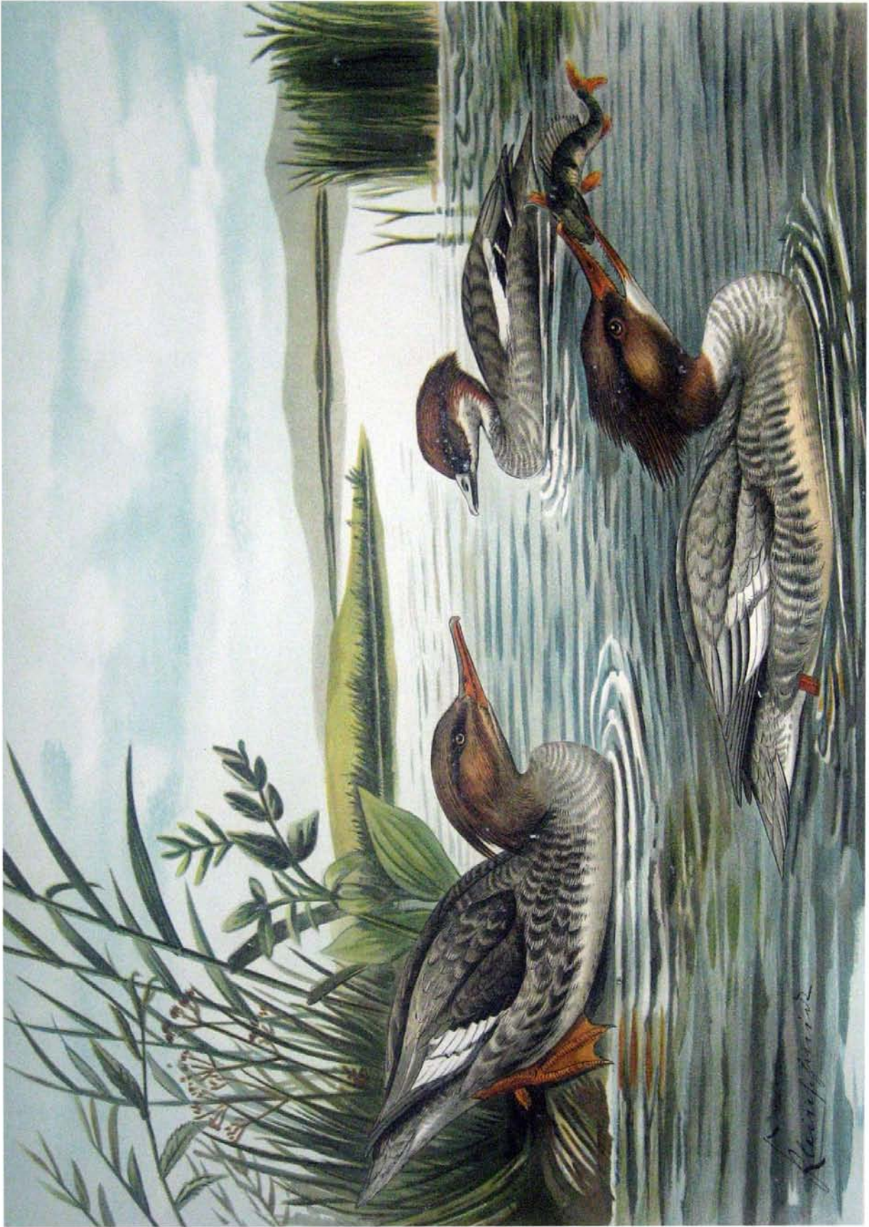
Mergus merganser L. Grosser Säger. 1 Weibchen. Mergus serrator L. Mittlerer Säger. 2 Weibchen.