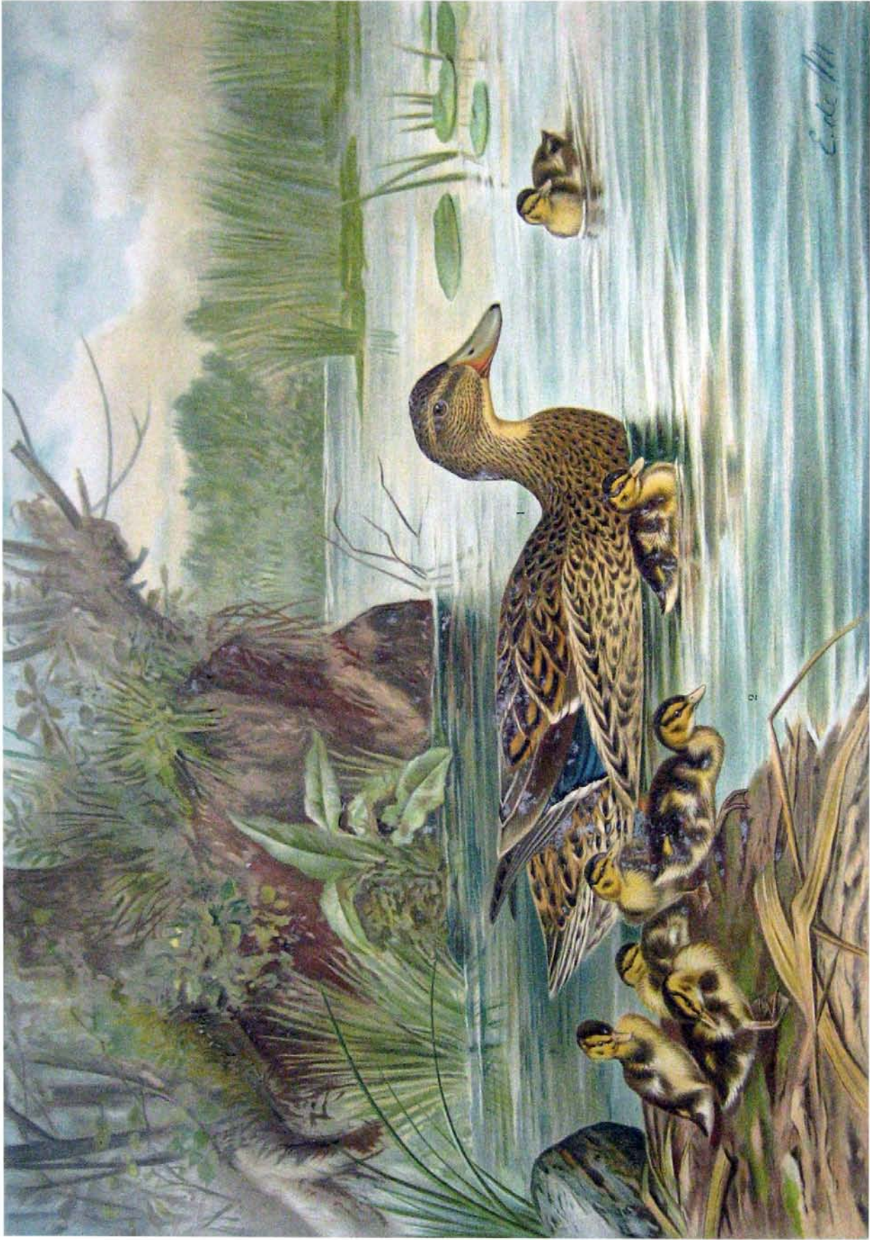
Anas boschas L. Märzente. 1 Weibchen. 2 Dunenjunge. 3/4 natürl. Größe.