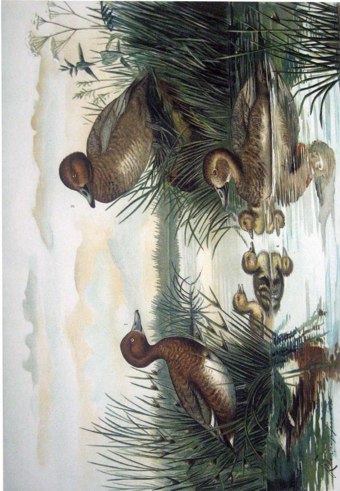
Fuligula nyroca (Güldenst.). Moor-Ente. 1 Männchen im Sommerkleide. Fuligula ferina (L.). Tafel-Ente. 2 Männchen vor der Herbstmauser. 3 Weibchen. 4 Dunenjunge. 2/3 natürl. Größe.