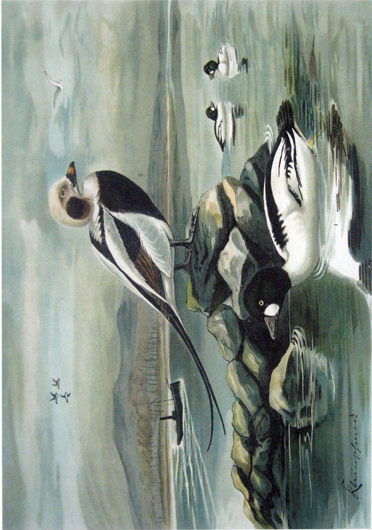
Fuligula clangula (L.). Schellente. 1 Männchen im Prachtkleid. 2 Männchen im Prachtkleid., 3/4 natürl. Gefesse. Harelda hyemalis (L.). Eisente. 2 Männchen im Prachtkleid., 3/4 natürl. Gefesse.