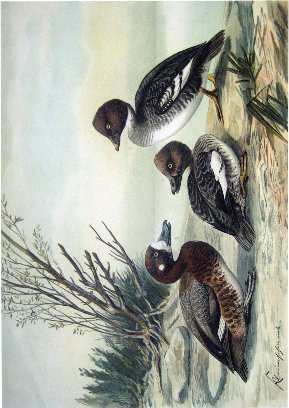
Fuligula clangula (L.). Schell-Ente. Fuligula marila (L.). Berg-Ente.