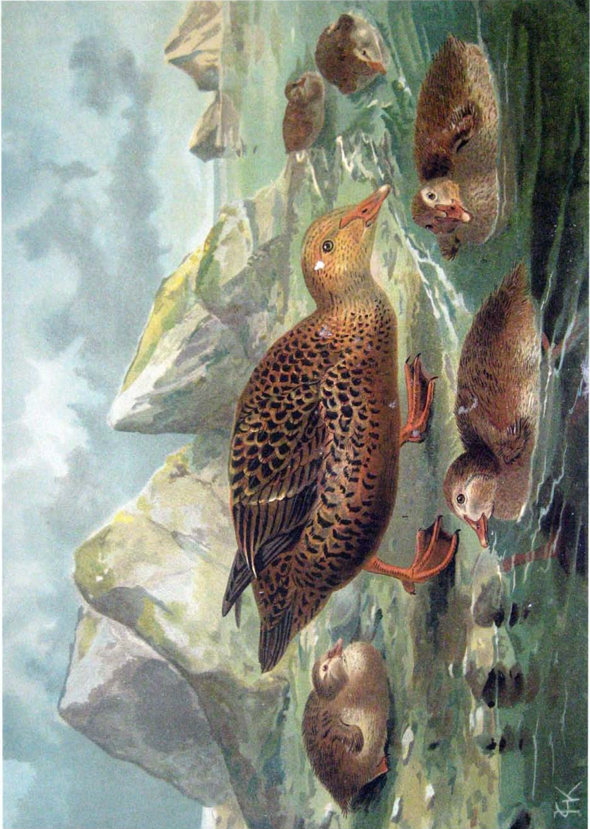
Somateria spectabilis (L.). Pracht-Eiderente. 1 Weibchen. 2 Dunenjunge. 3/5 natürl. Grösse.