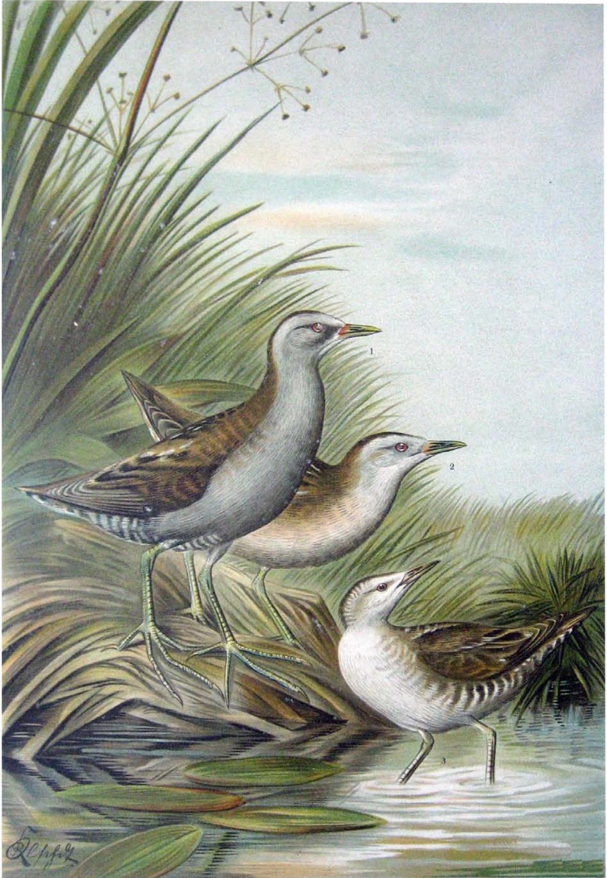
Ortygometra parva (Scop.) Kleines Sumpfhuhn. 1 Männchen im Frühling. 2 Weibchen im Frühling. 3 junger Vogel. Natürl. Grösse.