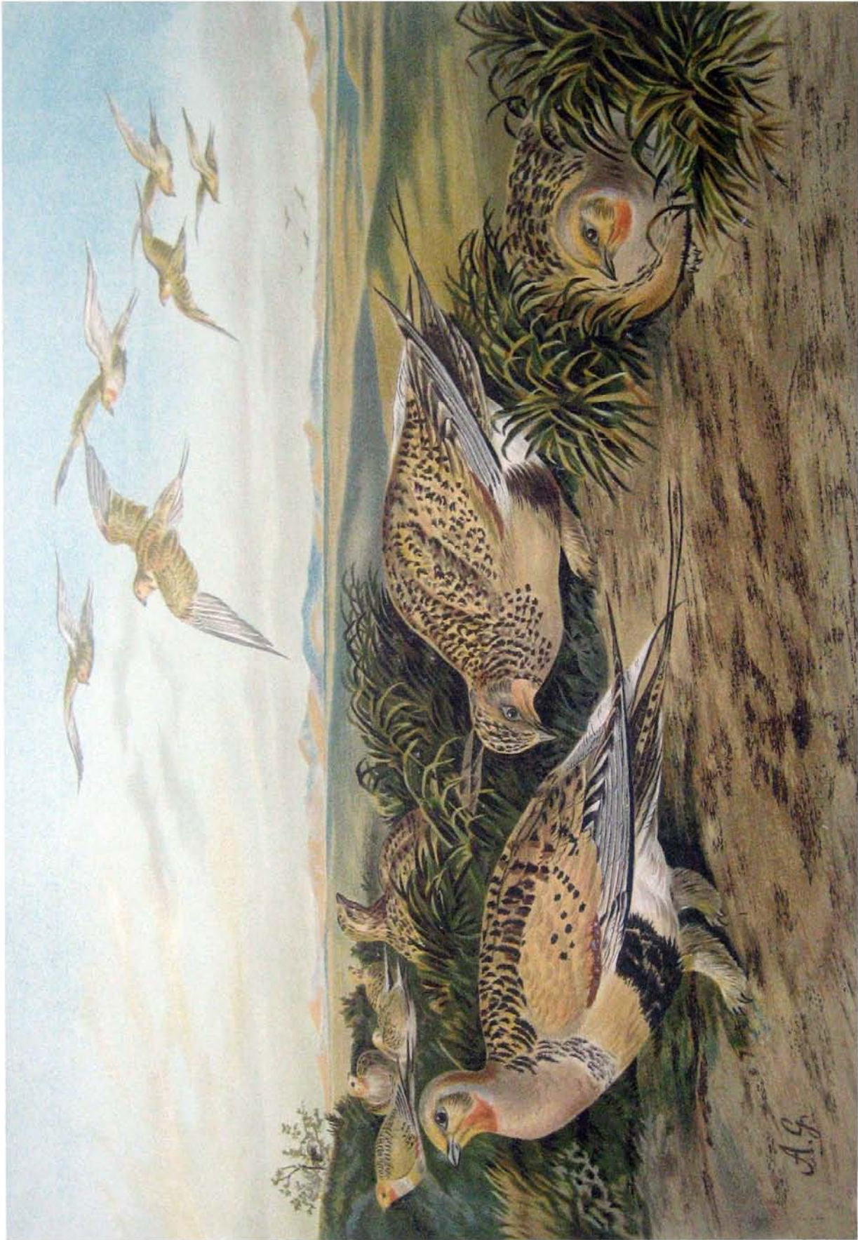
Syrrhaptes paradoxus (Pall.) Steppenhuhn. 1 altes Männchen. 2 altes Weibchen. 1/2 naturl. Grösse.