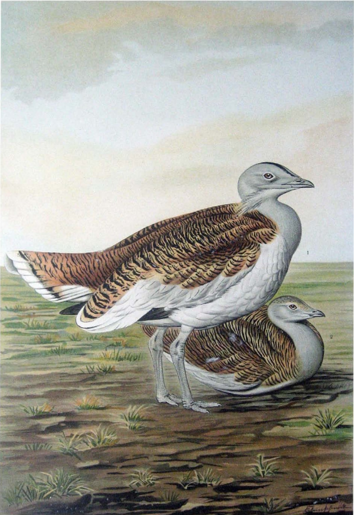
Otis tarda L. Grosstrappe. 1 Männchen. 2 Weibchen. ¼ natürl. Grösse.