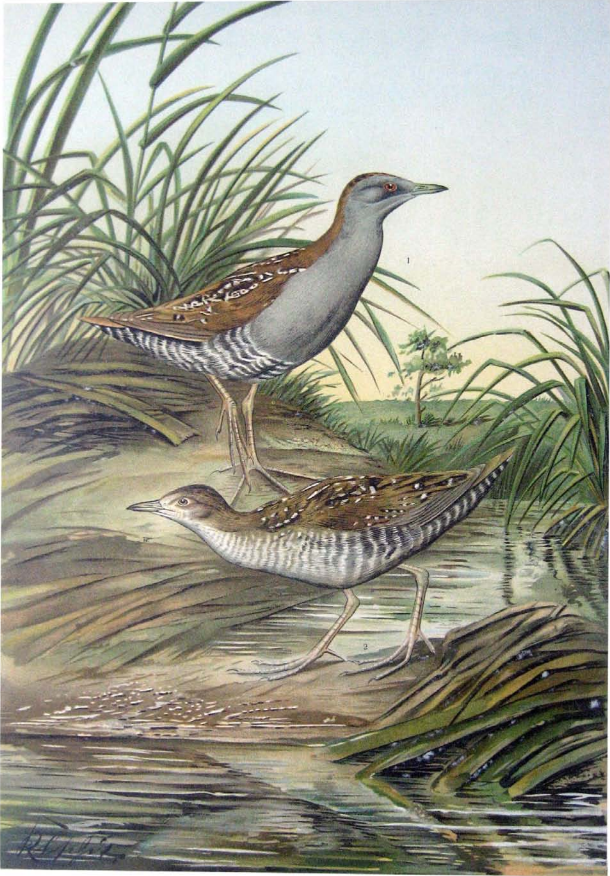
Ortygometra pusilla (Pall.). Zwergsumpfuhn. 1 altes Weibchen. 2 junger Vogel. 2/3 natürl. Grösse.