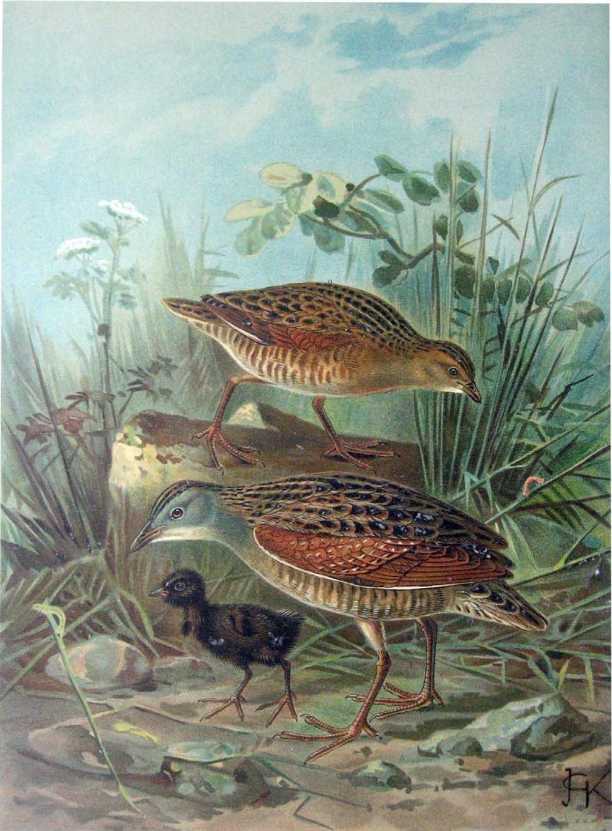
Crex crex (L.). Wiesensumpfhuhn. 1 altes Männchen. 2 altes Weibchen. 3 Dunenjunge. 2/3 natürl. Grösse.