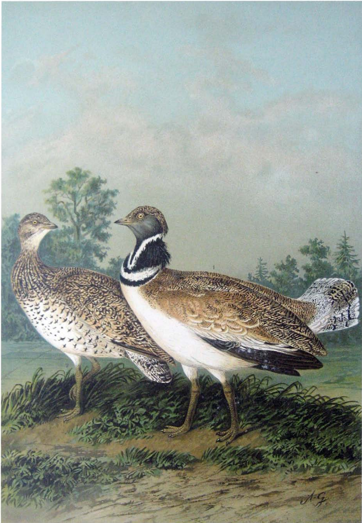
Otis tetrax L. Zwergtrappe. 1 Männchen. 2 Weibchen. \frac{2}{3} natürl. Grösse.