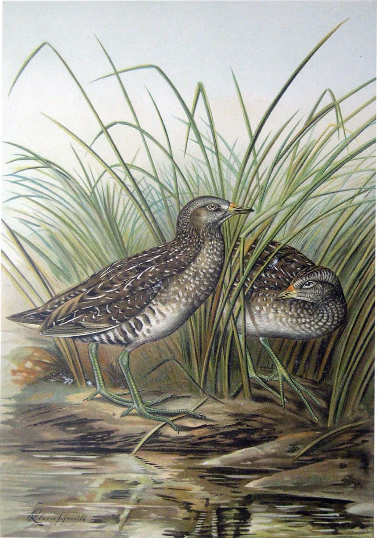
Ortygometra porzana (L.). Gesprenkeltes Sumpthuhn. 1 altes Vogel. 2 junger Vogel im Herbst. Natürl. Grösse.