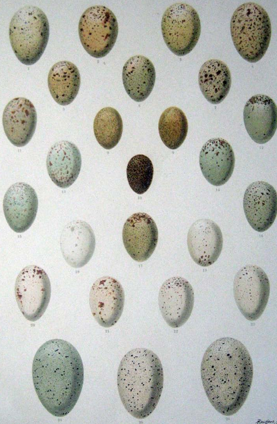
1—4 Gallinula chloropus (L.), Gemeines Teichhuhn; 5—7 Ortygometra porzana (L.), Gesprenkeltes Sumpfhuhn; 8—9 Ortygometra pusilla (Pall.), Zwergsumpfhuhn; 10 Ortygometra parva (Scop.), Kleines Sumpfhuhn; 11—17 Crex crex (L.), Wiesen sumpfhuhn; 18—23 Rallus aquaticus L., Wasserralle; 24—26 Fulica atra L., Gemeines Wasserhuhn.