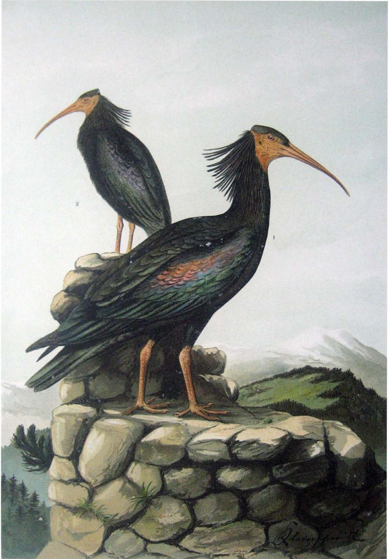
Geronticus eremita (L.). Waldraup. 1 in frischem Gefieder. 2 in abgenutztem Gefieder. \frac{1}{2} natürl. Grösse.