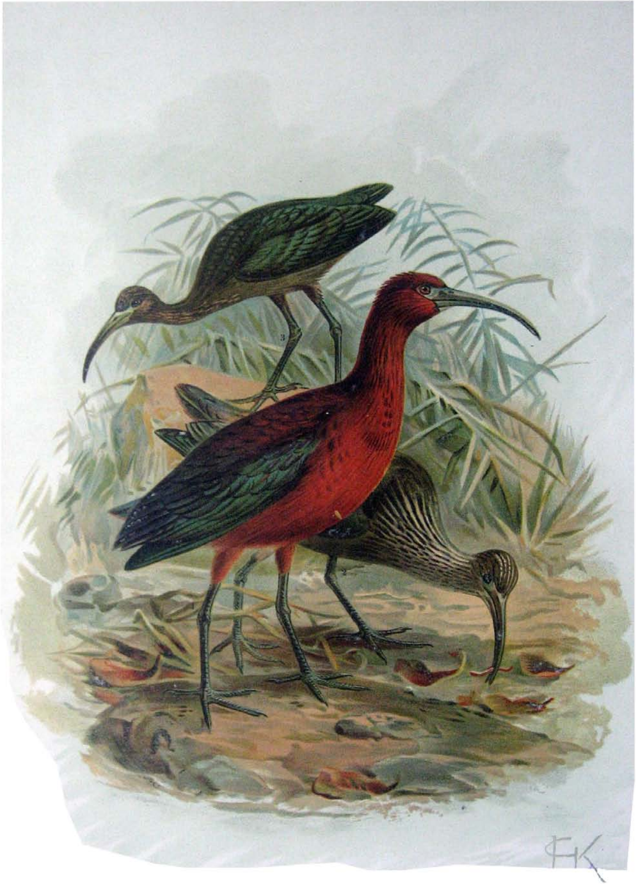
Plegadis falcinellus (L.). Dunkelfarbiger Sichler. 1 Männchen im Sommerkleide. 2 Männchen im ersten Weibchen. 3 Männchen im Jugendkleide. \frac{1}{2} natürl. Grösse.