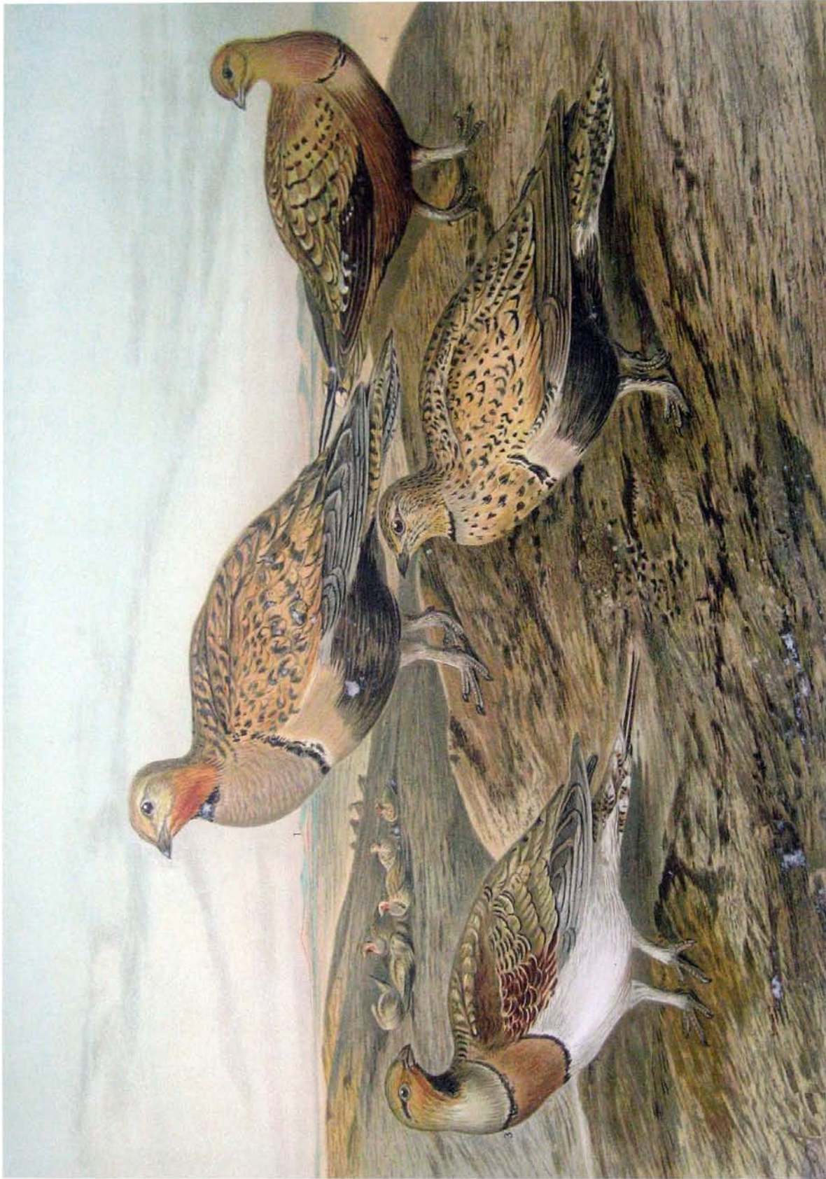
Pterocles arenarius (Pall.) Sandflughuhn. 1 Männchen. 2 Weibchen. Pterocles alchata (L.) Spießflughuhn. 3 Männchen. Pterocles exustus Temm. Wüstenflughuhn. 4 Männchen. 1/5 natürl. Größe.