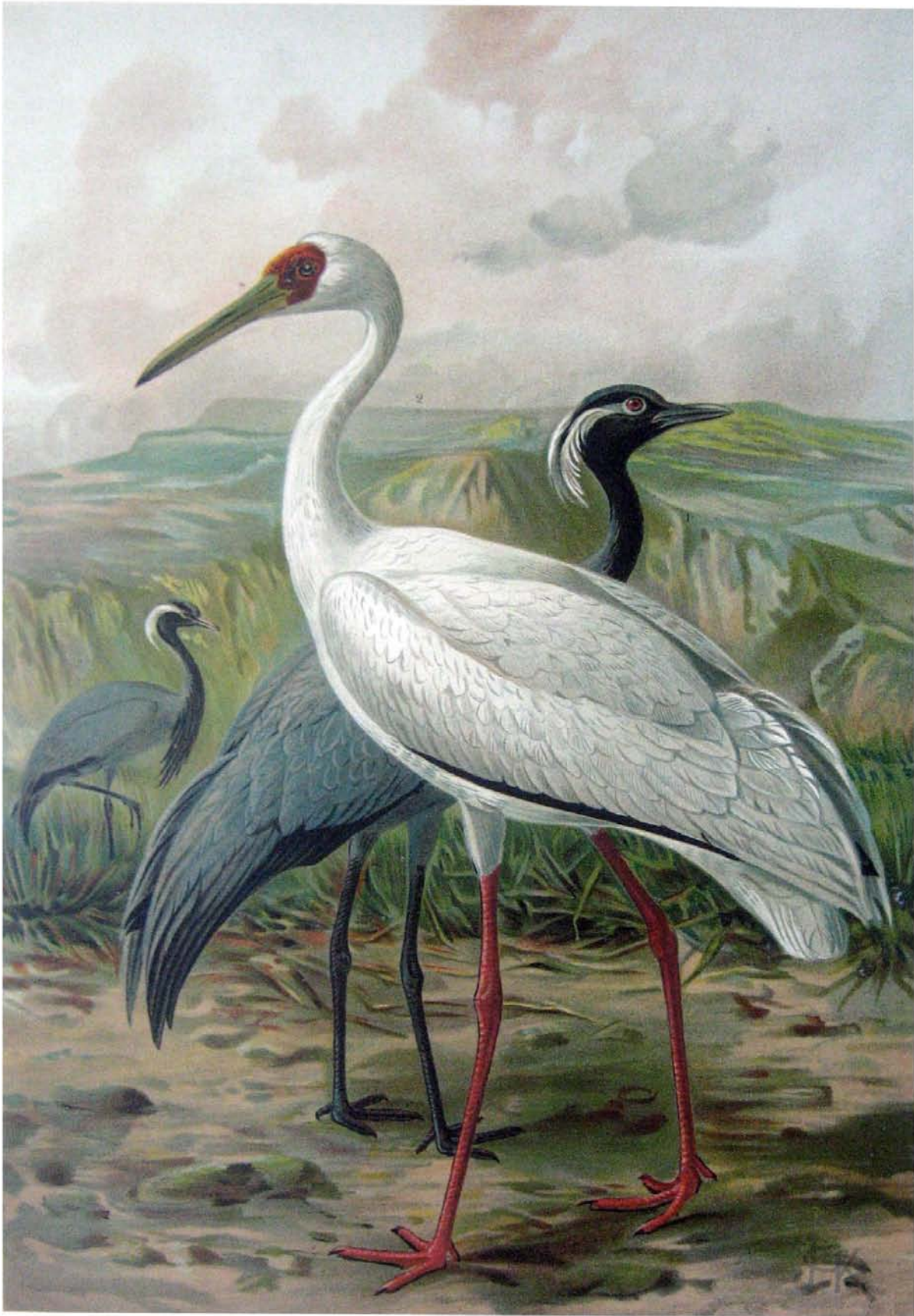
Grus virgo (L.). Jungfernkranich. 1 Männchen. Grus leucogeranus Pall. Mönchskranich. 2 Männchen. ½ natürl. Grösse.