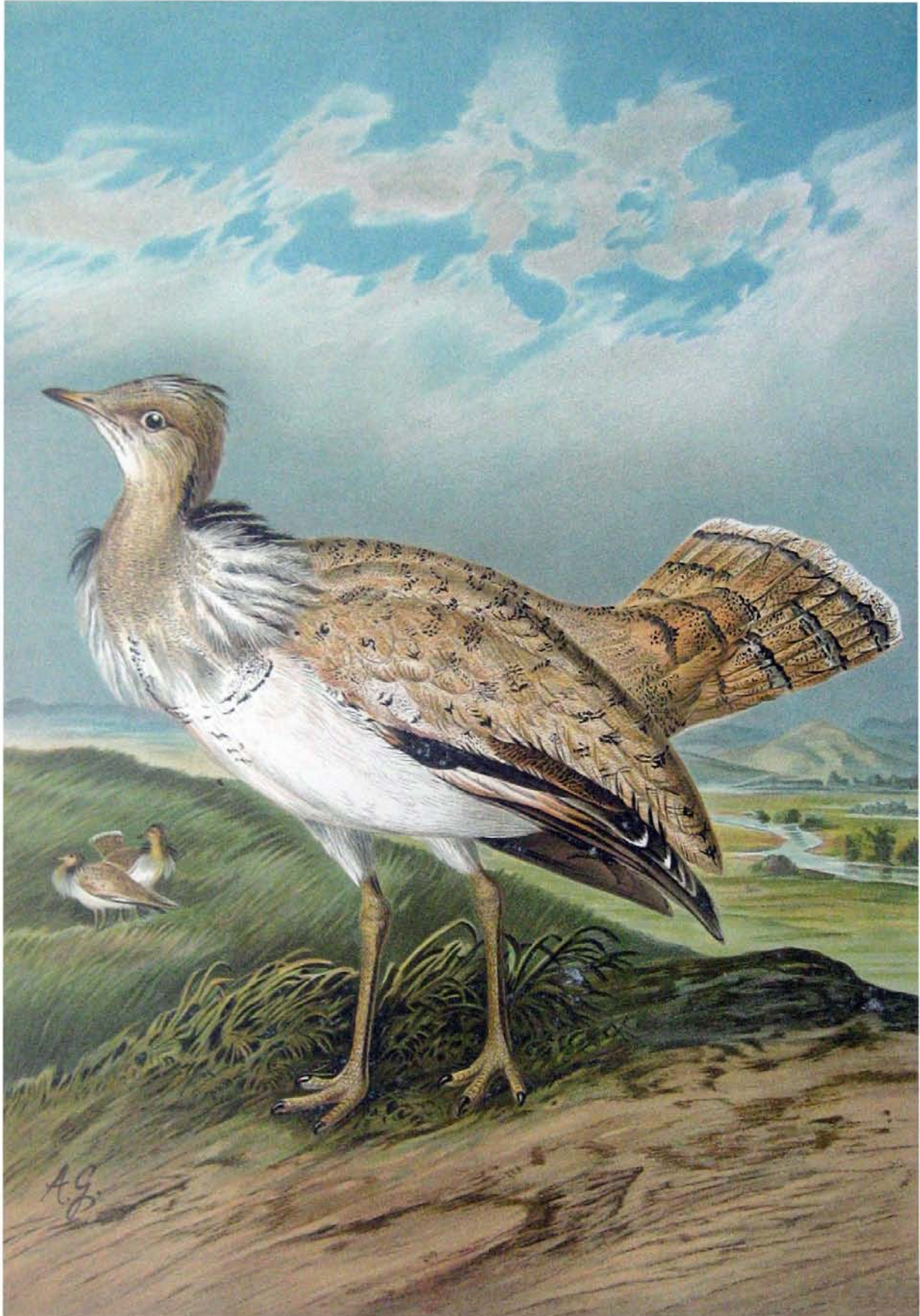
Houbara Macqueeni Gray. Asiatische Kragentrappe. Männchen.