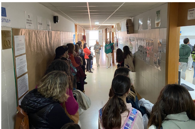
Explicando el proyecto a las familias