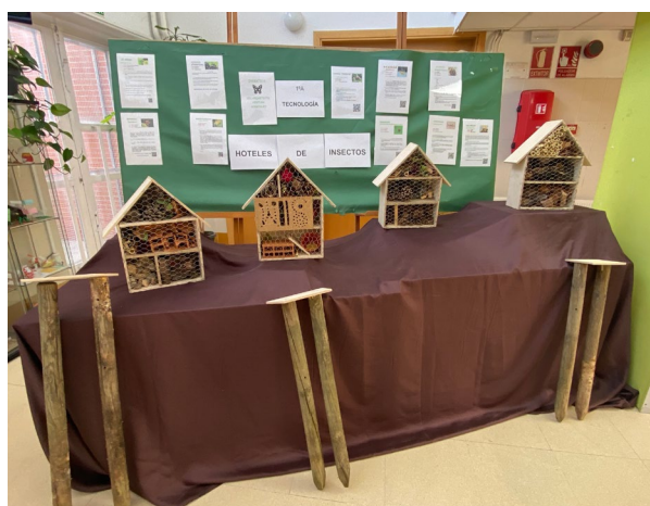
Vídeo construcción Hoteles de Insectos