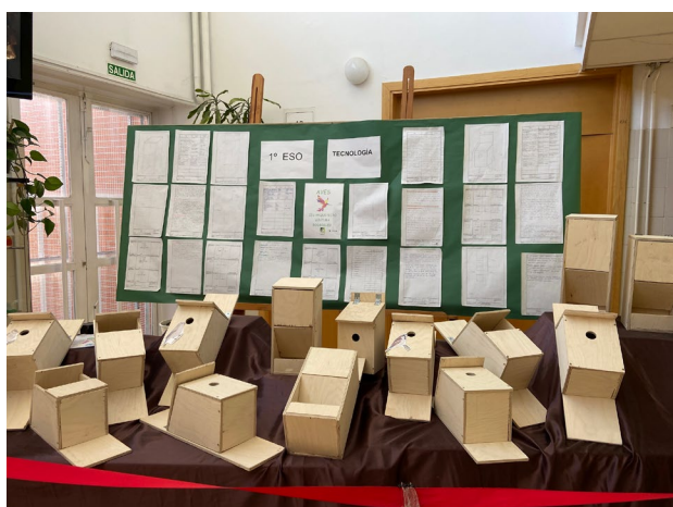
Vídeo construcción casa de aves