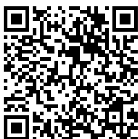
Código QR con el diseño del banco